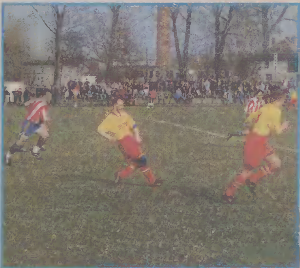
Piłkarze Borowiaka (w żółtych koszulkach) mają szansę świętować już w niedzielę awans do V ligi.