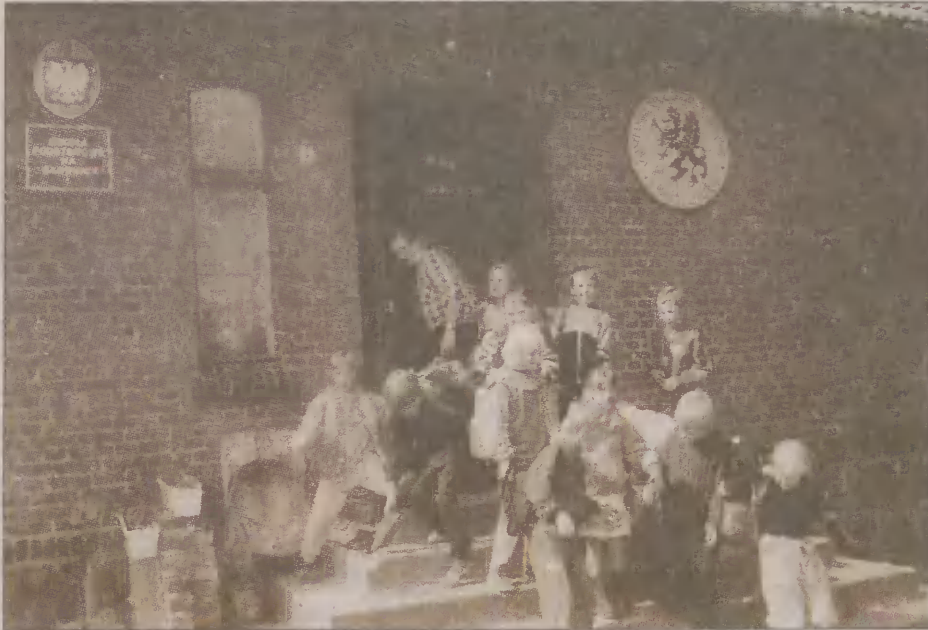
Kaszubska Szkoła Podstawowa w Głdniczy od września przestanie istnieć

Władze gminy Linia nie podjęły ostatecznej decyzji co do dalszych losów budynku likwidowanej od września kaszubskiej szkoły. Zarząd Gminy na ostatnim posiedzeniu uznał, że nie jest możliwe dalsze utrzymanie szkoły. Władze chcą raczej rozważyć