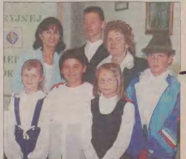
I Konkurs Poezji Maryjnej odbył się w Kościerzynie.