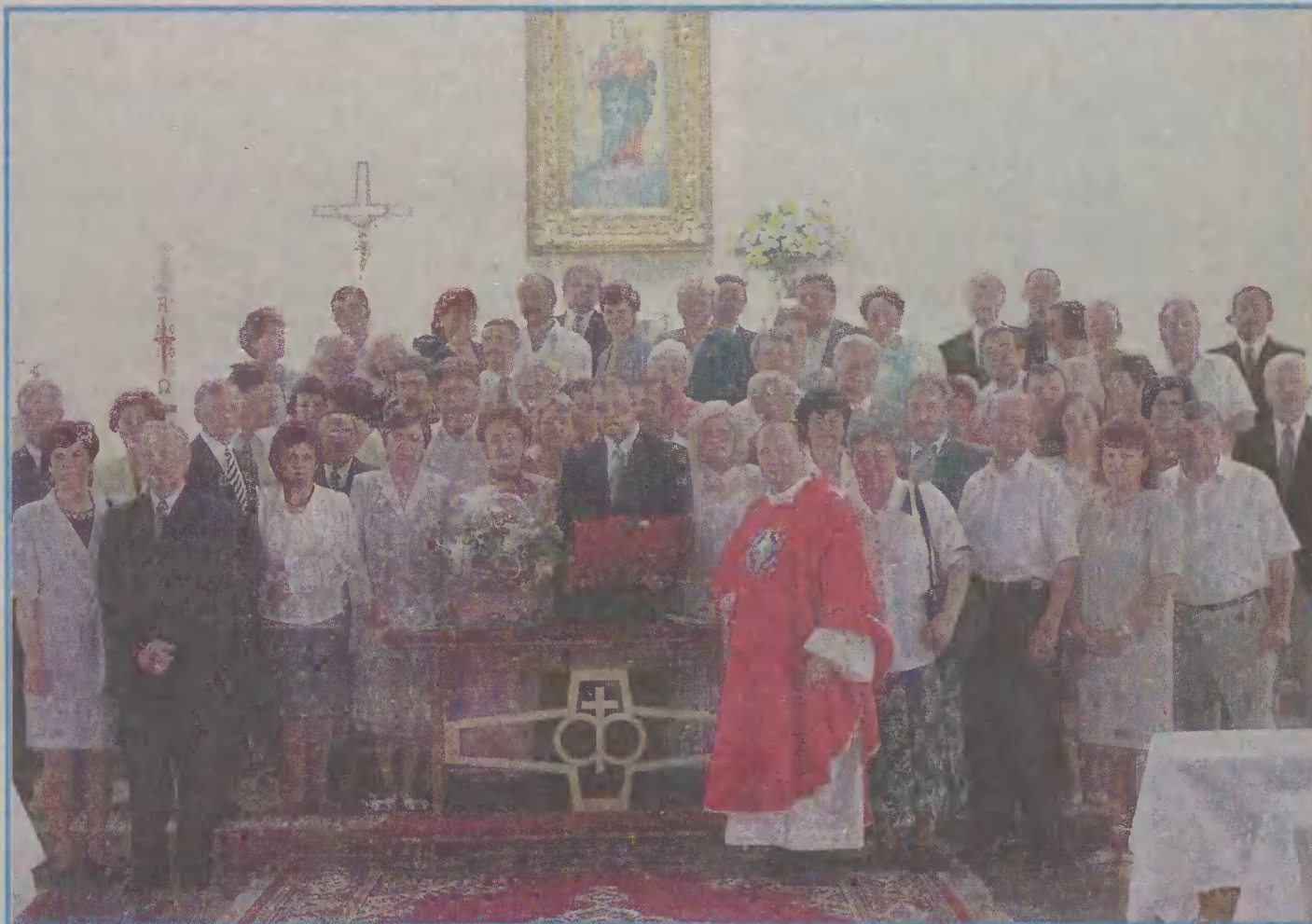
Na uroczystą mszę zaproszenia otrzymały pary obchodzące swoje jubileusze.