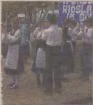
Podczas regat publiczność podziwiała kaszubskie tańce.