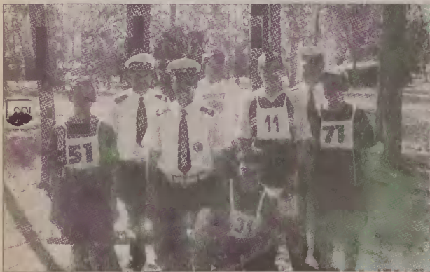
Zwycięska ekipa w towarzystwie policjantów z Wydziału Ruchu Drogowego.