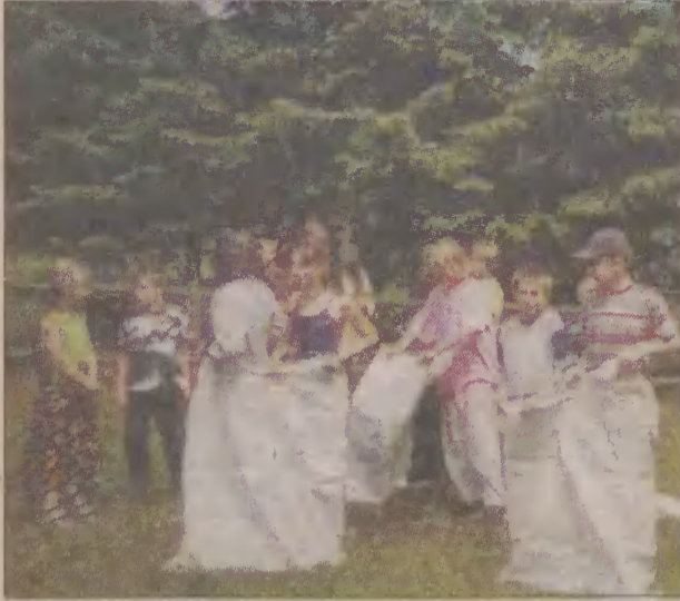
Najwięcej emocji w Piekietku wzbudził bieg w workach.