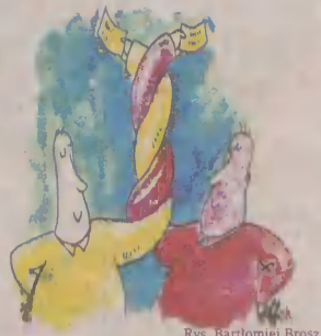
Rys. Bartłomiej Brosz

- Stëchòjta! Jò wama nick nie zrobiã, le pòwiedzta mie, w czim jò sã nie pòłapòł.