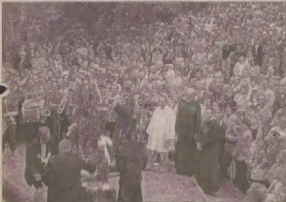
Ukłonami feretronu witano się z pielgrzymką z Kościerzyny.