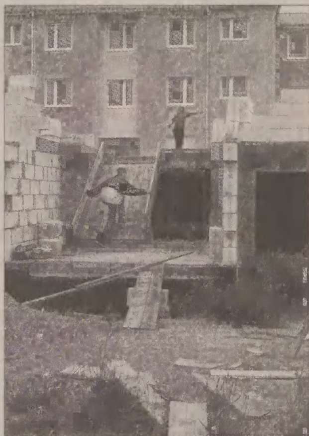
Na niezabezpieczonym terenie budowy bawią się dzieci. W takich warunkach nietrudno jest o wypadek.