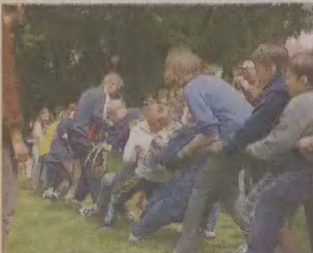
Przeciąganie liny było również jednym z konkursów na festynie w Parku Żelewskiego.