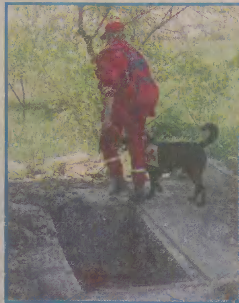
Kilkudziesięciu ratowników PCK tuż po zaginięciu kolegi natychmiast przystąpiło do trwających kilka dni poszukiwań.