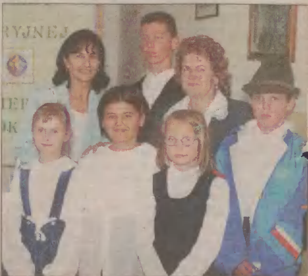
I Konkurs Poezji Maryjnej odbył się w Kościerzynie.