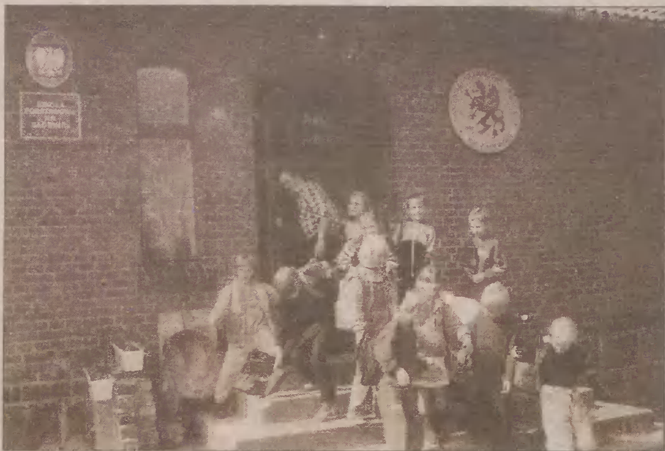
Kaszubska Szkoła Podstawowa w Głodnicy od września przestanie istnieć

Władze gminy Linia nie podjęły ostatecznej decyzji co do dalszych losów budynku likwidowanej od września kaszubskiej szkoły. Zarząd Gminy na ostatnim posiedzeniu uznał, że nie jest możliwe dalsze utrzymanie szkoły. Władze chcą raczej rozważyć