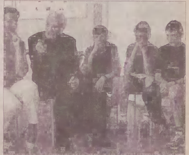
Gość opowiadał też o latach swojej młodości.

- Gdybym sam tego nie przeżył, nigdy nie uwierzyłbym, że coś takiego miało