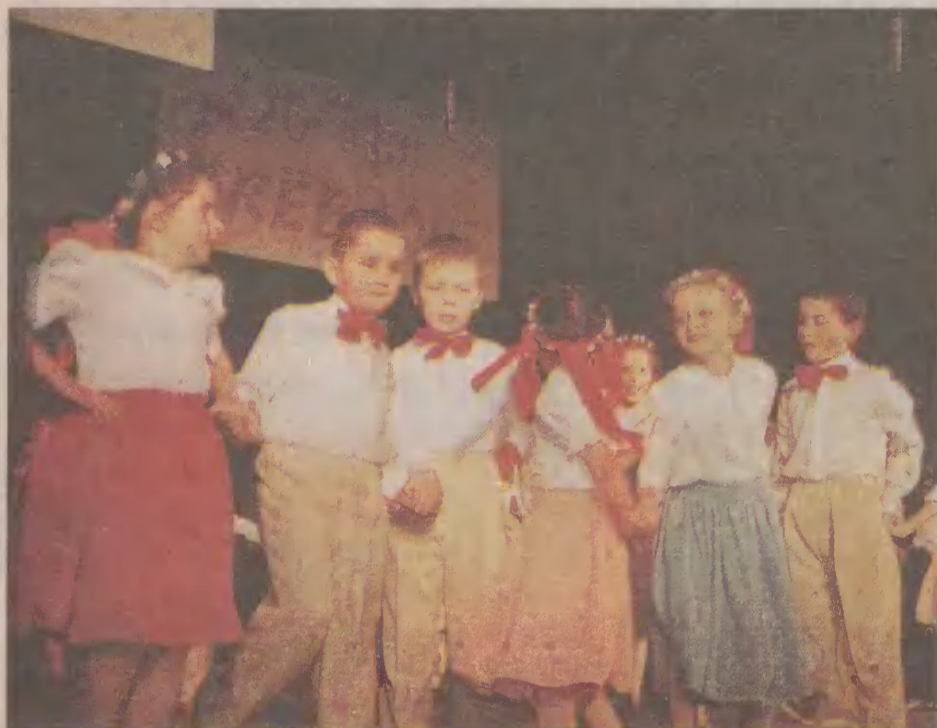
W zespole tańczą również najmłodsi brusacy.