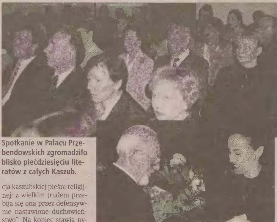
Spotkanie w Pałacu Przebendowskich zgromadziło blisko pięćdziesięciu literatów z całych Kaszub.

Ks. Perszon przedstawił w swoim referacie rolę śpiewu na Kaszubach w ostatnich wiekach, badania naukowe, twórczość ludową w tej dziedzinie oraz obecny stan kaszubskiej pieśni. Pisał w nim tak: „Brak, jak do popularnego śpiewnika podstawowych piosenek kaszubskich. Zadania promocji i systematycznej dystrybucji materiałów muzycznych (śpiewników, nut dla chórów, kompozycji instrumentalnych) nie wypełnia ZKP, choć można by tego od tej organizacji oczekiwać. Nie wiele zrobiono też w kwestii pobudzania kaszubskojęzycznej twórczości słownej i muzycznej, a wiadomo, iż ona najbardziej świadczy o żywotności i rozwoju naszej kultury. Wiele do życzenia pozostawia popularyza-