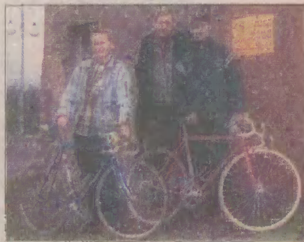
Wyposażenie jednego zawodnika kosztuje 2,5 tys. zł

- Chciałbym podziękować panu Ludwikowi Bachowi,