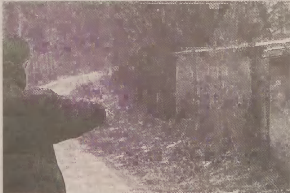
W tym miejscu doszło do gwałtu.

Kiedy jednak kobieta zrobiła kilka następnych kroków, spostrzegła, że leżący mężczyzna poderwał się i ucieka w pośpiechu zakładając ubranie. W tej samej chwili zobaczyła, że podnosząca się z ziemi druga osoba, to młoda przerażona dziewczynka. Kobieta chciała pobiec za uciekającym mężczyzną, ale dziewczynka chwyciła ją mocno za rękę i prosiła, żeby nie