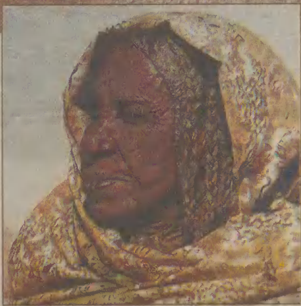
Kobieta z plemienia Shaigiya w Sudanie.