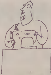
Rys. Bartłomiej Brosz