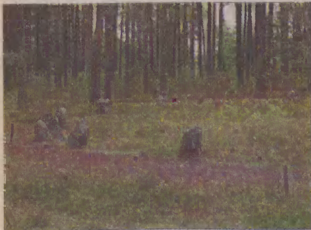
Choć kamienne kręgi w Odrach stanowią cmentarzysko, wciąż kryją tajemnice.