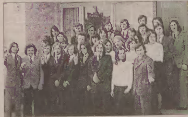
A tak wyglądali 25 lat temu.