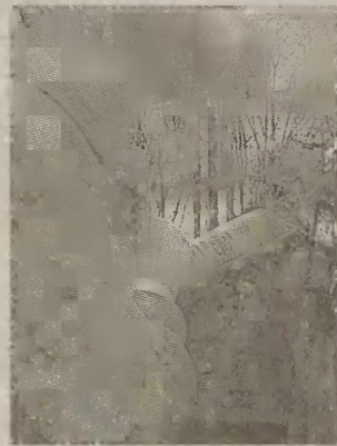
Gaśnica ma określony termin gwarancji.

Na terenie naszej gminy działają specjalistyczne punkty zajmujące się nabianiem i legalizacją gaśnic, także samochodowych. Warto więc sprawdzić własną gaśnicę samochodową i w razie potrzeby, zawieźć ją do punktu zajmującego się legalizacją np. w straży