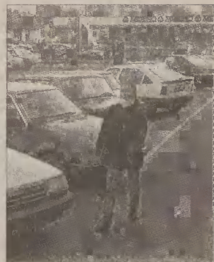
W tym roku ceny aut spadły nieznacznie.

Taki zastój notowany jest co roku. Sprzedawcy liczą na to, iż zainteresowanie wzrośnie na przełomie lutego i marca. Na zainteresowanie