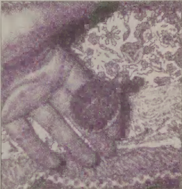
Filip lubi spać pod pierzynką, pożyczoną z łóżeczka lalerek.