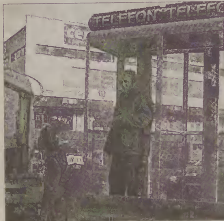
Także przed Urzędem Miejskim stanęły dwie nowe budki, przystosowane do potrzeb osób niepełnosprawnych.