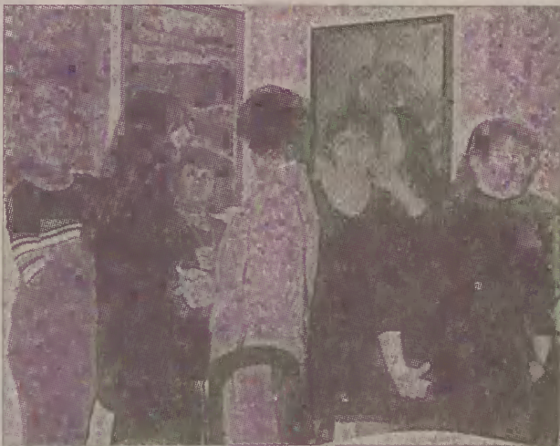
Prace młodej malarki z Kętrzyna podobały się uczestnikom wernisażu w Pałacowej.