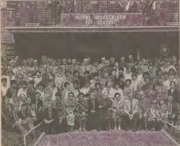
Pamiątkowe zdjęcie z VIII Zjazdu Absolwentów Liceum Pedagogicznego w 1985 roku.