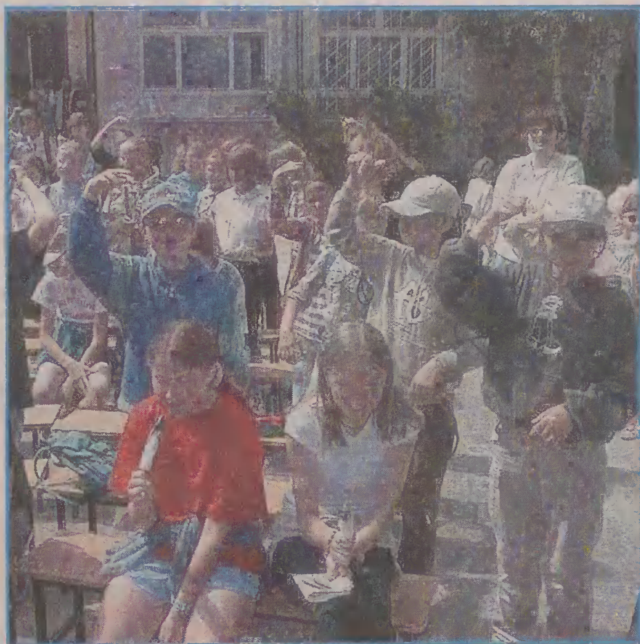
Uczniowie Zespołu Szkół nr 3 mają nadzieję, że festyn rodzinny, przygotowany przez ich szkołę, zwycięży w konkursie ogłoszonym przez burmistrza.