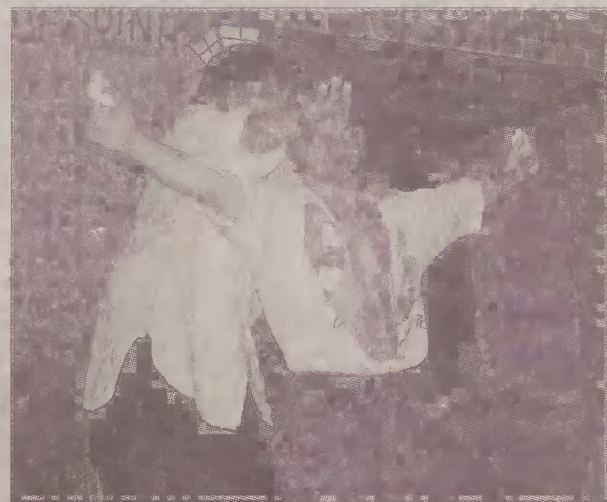
- Co ty wiesz o problemach - pyta stary narkoman młodego.

przychodzi do niego „pożyczyć” działkę, ten opowiada mu swoją historię - mówi, że tak naprawdę nie miał powodów, żeby zacząć ćpać. Miał żonę, dziecko, samochód. Stracił wszystko. Zapomnienia szuka w narkotykach. Spektakl kończy się sceną śmierci starego narkomana. Diler, który dostarczał narkotyki, został dźgnięty nożem w plecy. Nad małolatem klęczy jego ojciec. Pastor opiekujący się mieszkańcami bloku ma wątpliwości, czy jego posługa ma sens. - Oni znaleźli już swoje schody do nieba, czy nie za wcześniej (...) Panie,