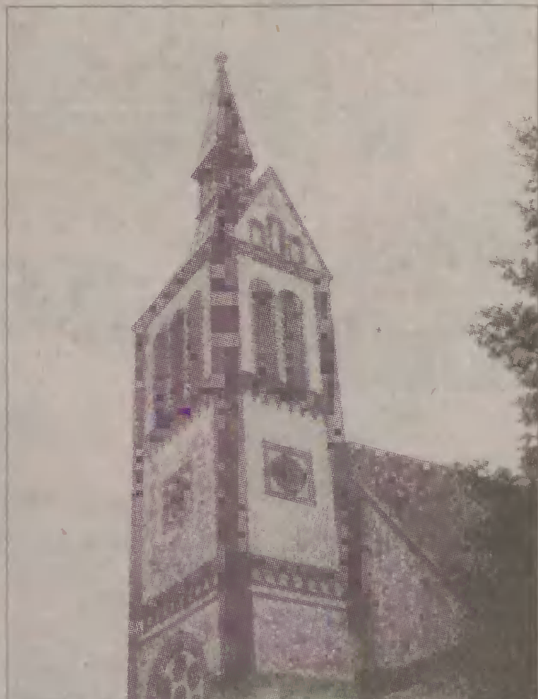
Zabytkowy kościół pochodzi z 1802 r.