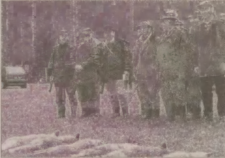
Myśliwi upolowali sześć lisów.

- Upolowanie lisa nie jest łatwe, gdyż chodzi on własnymi ścieżkami - zdradził myśliwy. - Zachowanie myśliwego musi być bardzo dyskretne. Lis, do którego strzelałem, wędrował po lesie w odległości 10 metrów ode mnie.