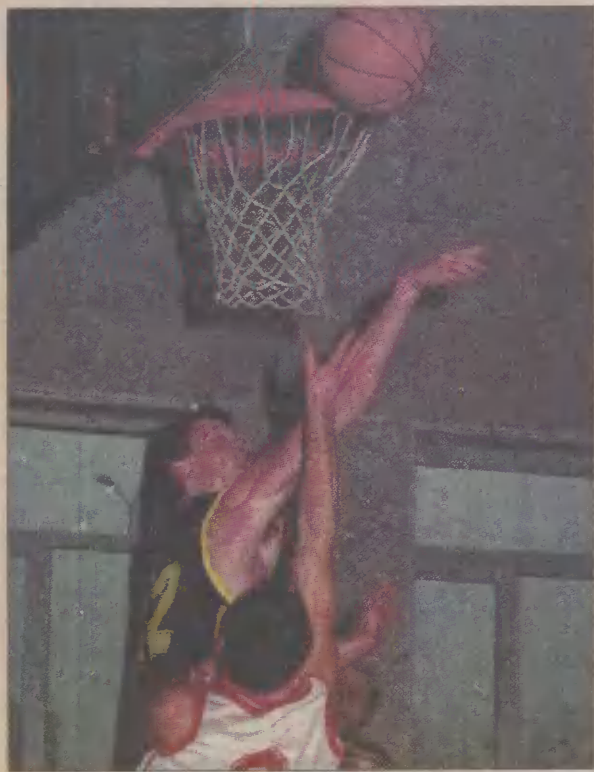
Pierwsze rozgrywki odbyły się w sobotę.