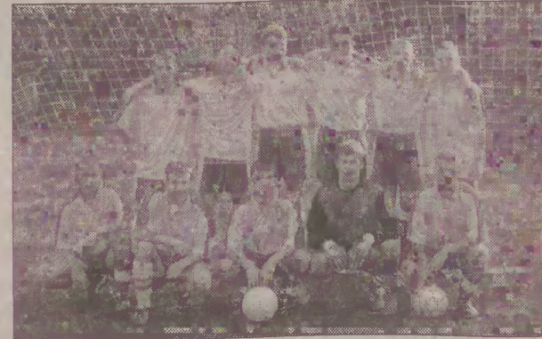
Drużyna Korala Dębница w pełnym składzie.

- Przed rozpoczęciem sezonu twierdzono, że jeżeli dobrze pójdzie, to uda nam się wywalczyć trzy punkty -