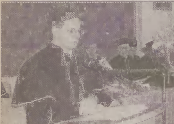
Jan Król, wicemarszałek Sejmu wygłosił inauguracyjny wykład.