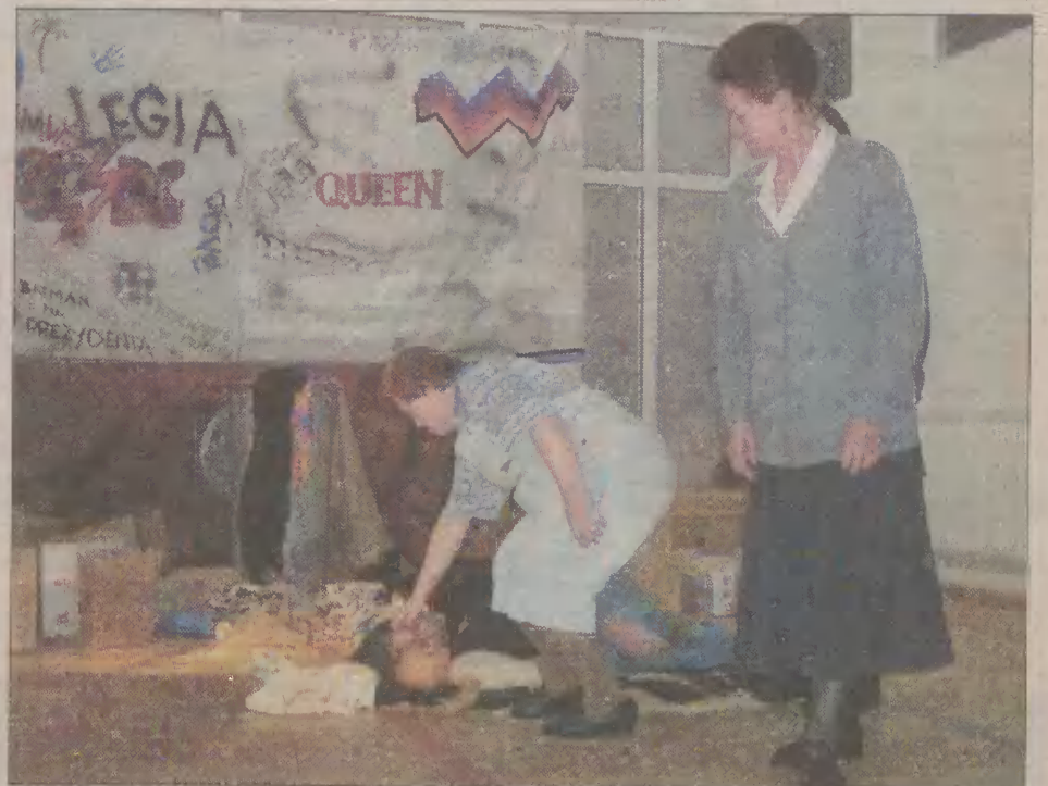
Podopieczne DPS w Czarnem przedstawiły pantomimę „Nie pogardzaj szarym człowiekiem”.

- Chodziło nam o podzielenie się doświadczeniami w prowadzeniu warsztatów terapii zajęciowej. W konferencji wzięli udział przede wszystkim dyrektorzy placówek domów pomocy społecznej z woj. pomorskiego, kierownicy powiatowych i miejskich centrów pomocy rodzinie, przedstawiciele stowarzyszeń działających w naszym województwie, jak również bezpośrednio zainteresowane osoby niepełnosprawne.