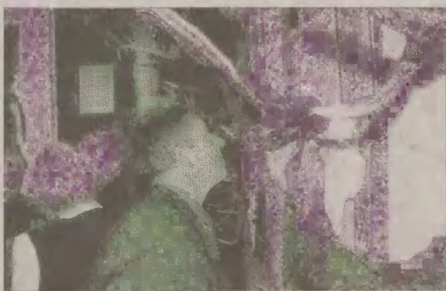
Wystawa cieszy się dużym powodzeniem.

Muzeum Regionalne w Człuchowie przygotowało wystawę tematyczną związaną ze świętem myśliwych. Nosi ona tytuł: „Trofea łowieckie z kół łowieckich powiatu człuchowskiego”.