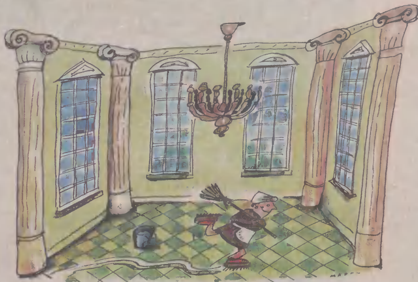
Rys. Marek Wdziękoński

N ajwiększym powodzeniem wśród bezrobotnych kobiet w Koczale cieszy się sprzątanie ulic. Podczas spotkania z przedstawicielami człuchowskiego PUP panie pytały o takie właśnie oferty pracy. Prawie wcale nie było natomiast zainteresowania innymi propozycjami. A w ostatnim czasie było ich kilkadziesiąt. Większość ofert dotyczyło pracy w miasteczkiej chłodni i zakładzie krawieckim.