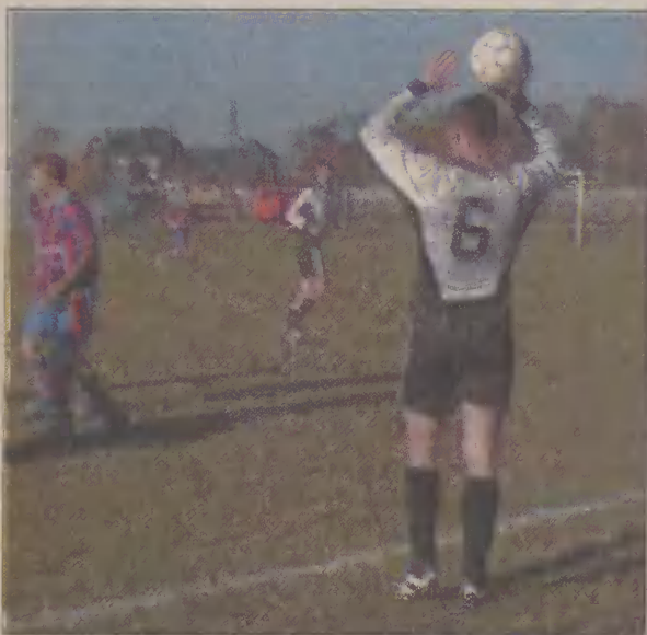
Czarni wygrają na wyjeździe umocnili swoją pozycję w tabeli.