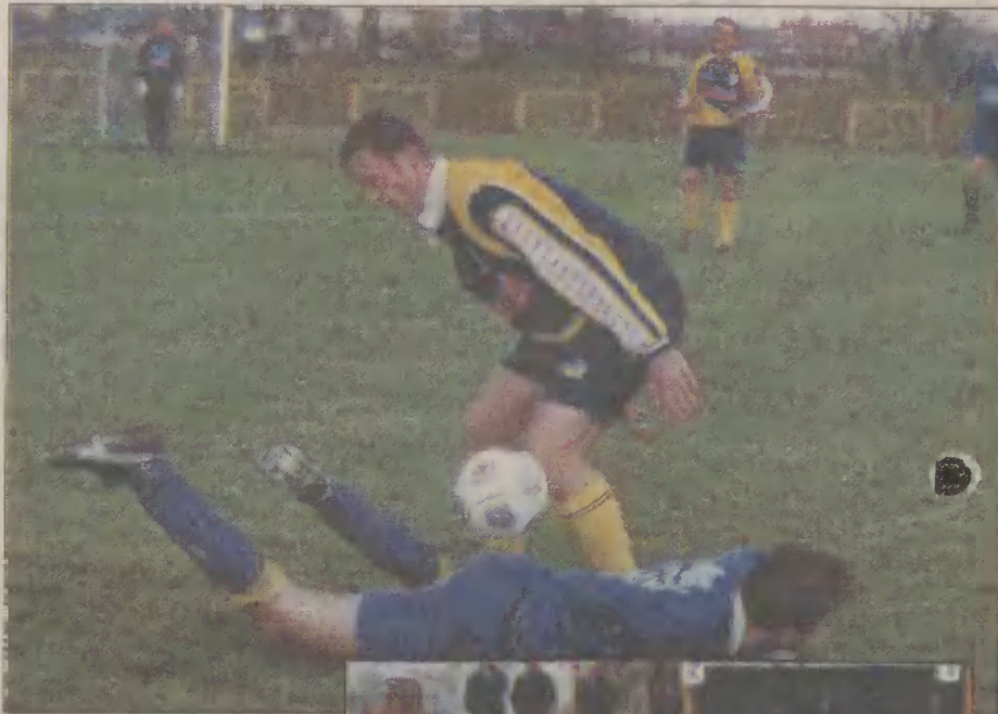
W drugiej połowie człuchowianie (w żółto-granatowych strojach) musieli ostro walczyć o każdą piłkę.

Kolejne mecze z czwartoligowymi rywalami będą wymagały od zawodników Piasta dużej uwagi i dobrej gry. Jeszcze w tym sezonie człuchowianie zagrają na wyjeździe z Lechią Polonia (po ostatnim meczu piąta w tabeli), u siebie z Fako Orkan (sąsiad Piasta w tabeli) i Cartusią Kartuzy (wielodierem rozgrywek). Ceka ich także zaległy mecz z Wisłą Tczew. Spotkanie zaplanowano na 26 listopada. Jednak, aby w tym terminie doszło do spotkania, muszą sprzyjać warunki atmosferyczne.