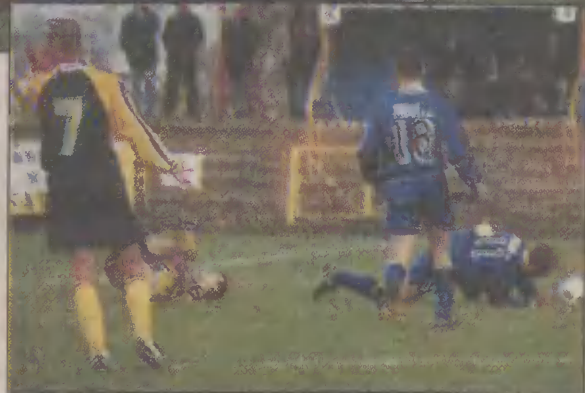
Mecz ofitował w ostre starcia. Trzema żółtymi kartkami za faule zostali ukarani gdańszczanie.