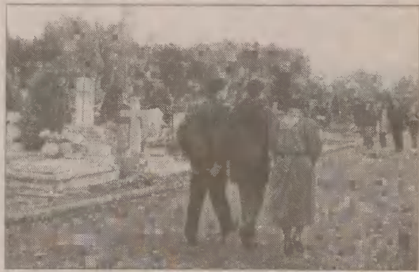
Odwiedzający cmentarz cieszą się, że nie muszą już brodzić w błocie.