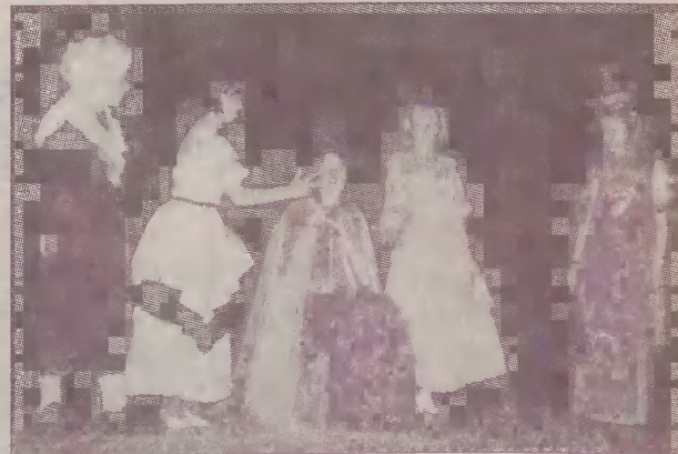
Członkowie zespołu Bajuj, baj lubią występować na scenie.

- Dzieci potrafią się zachować na scenie, doskonale wyczuwają sytuację. W zależności od reakcji publiczności wydłużają,