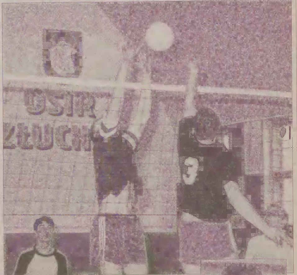
W Człuchowie ruszy trzecia edycja ligi siatkówki i koszykówki.