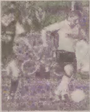
Człuchowskim olbojom (w czarnych strojach) nie udało się ładnie zakończyć sezonu.

Nie udało się oldbojom z Człuchowa udanie zakończyć pierwszej rundy rozgrywek. Mecz rozgrywano w trudnych warunkach atmosferycznych, przy nieustannie padającym deszczu. Gospodarze przeważali od początku meczu, co udokumentowali szybko zdobytą bramką. W 28 min kontaktowego gola strzelił Racut. Ten sam zawodnik później fatalnie przestrzelił z około pięciu metrów. Przed szansą na zmianę wyniku dwukrotnie stanął Arkuszyński, ale piłka po jego strzałach nie znalazła drogi do bramki. Niestety, później gole strzelali już tylko słupszczanie.