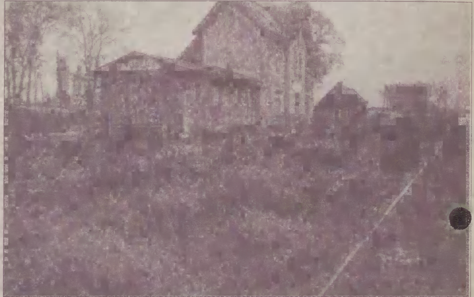
Budynki i tory - tylko to pozostało po linii kolejowej.

Pod koniec pociąg osobowy z Człuchowa jechał dwie i pół godziny - opowiada Józefa Kaszubowska, jed-