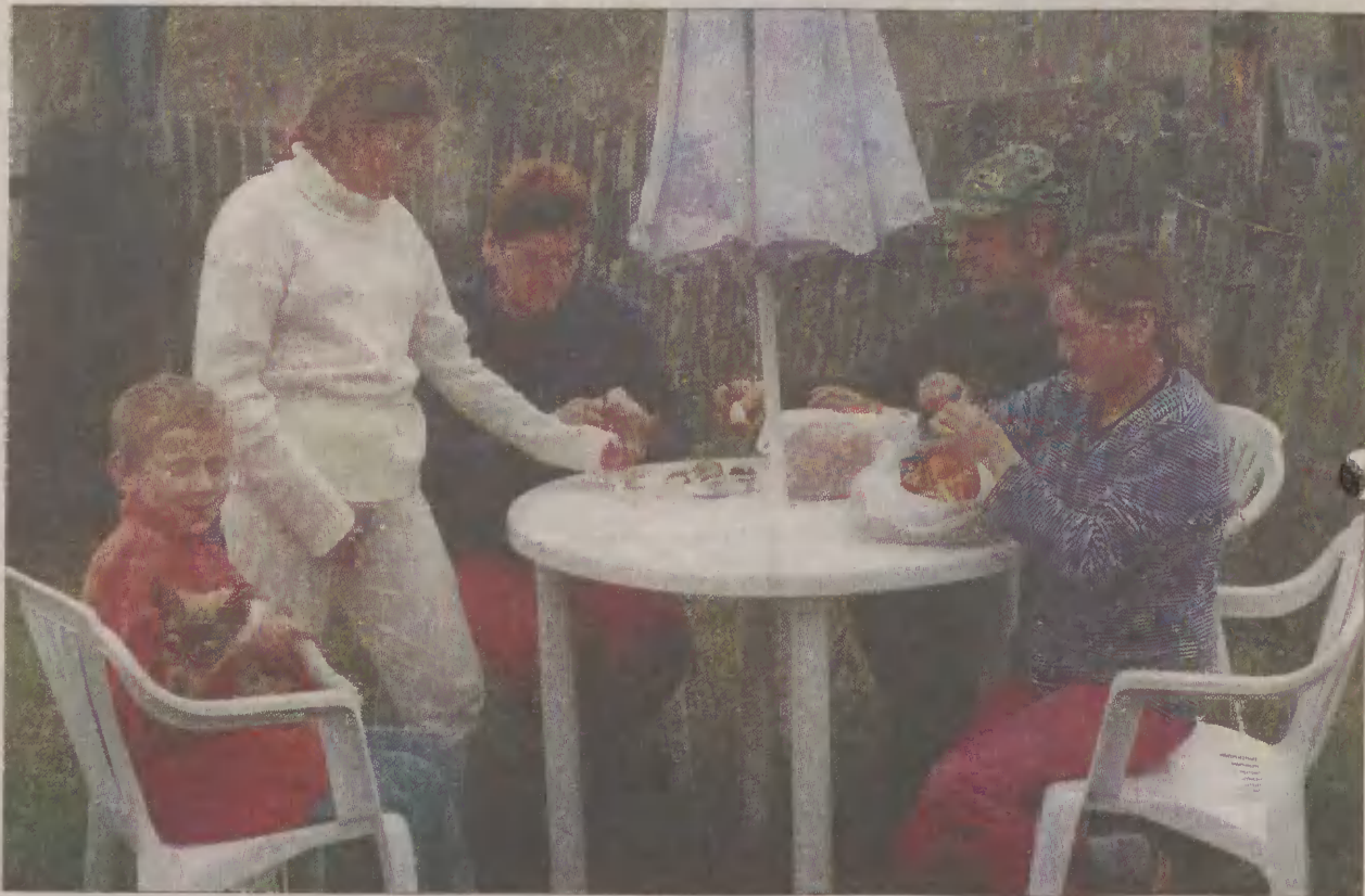
Rodzina utrzymuje się jedynie z prac sezonowych i zasiłku.

Według danych przechlewskiego GOPS, ok. 20 rodzin w gminie nie posiada żadnego dochodu. Z zasiłków okresowych korzysta 198 rodzin, w tym ze świadczeń tzw. gwarantowanych - 24 rodziny. Wysokość zasiłku okresowego w sierpniu br. wynosiła 49,80 zł, a celowego - 70 zł. Rodzinom, które wychowują dzieci, wypłacane są również zasiłki na wyposażenie do szkoły. W tym roku 92 rodziny otrzymały po 30 zł dofinansowania na jedno dziecko.