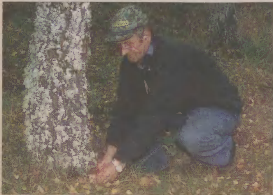
Latem Kantakowie całą rodziną chodzą na jagody, a jesienią - na grzyby.