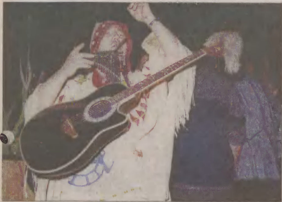
Człuchowianom bardzo podobał się koncert Przemysława Goca.