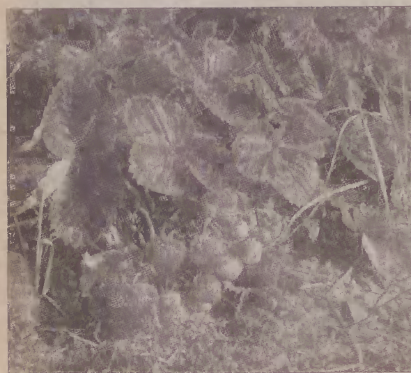
Wiele owoców już dojrzało i nadaje się do jedzenia. To dziwne - w październiku.

POWIAT. Truskawki rosnące na krzakach w październiku to prawdziwa rzadkość. W tym roku jest ich jednak dosyć dużo. Plantatorzy są trochę zaskoczeni, mówią jednak, że to, że truskawki owocują tak późno może źle wpłynąć na przyszłoroczne zbiory. Wielu więc obrywało kwiaty na kwitnących krzakach. (pif)