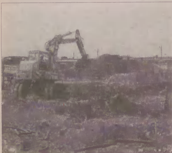
Trwają prace przy budowie nowego pawilonu w ZK w Czarnem.

Nowy pawilon na pewno w pewnym stopniu rozwiąże problem braku miejsc w czarnieńskim więzieniu. Obecnie w zakładzie przebywa ponad 1000 osadzonych. Według dyrektora w każdej chwili może zabraknąć miejsc. (pif)