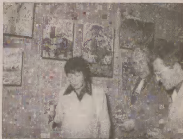
Uwieńczeniem pleneru była wystawa prac wykonanych podczas imprezy.