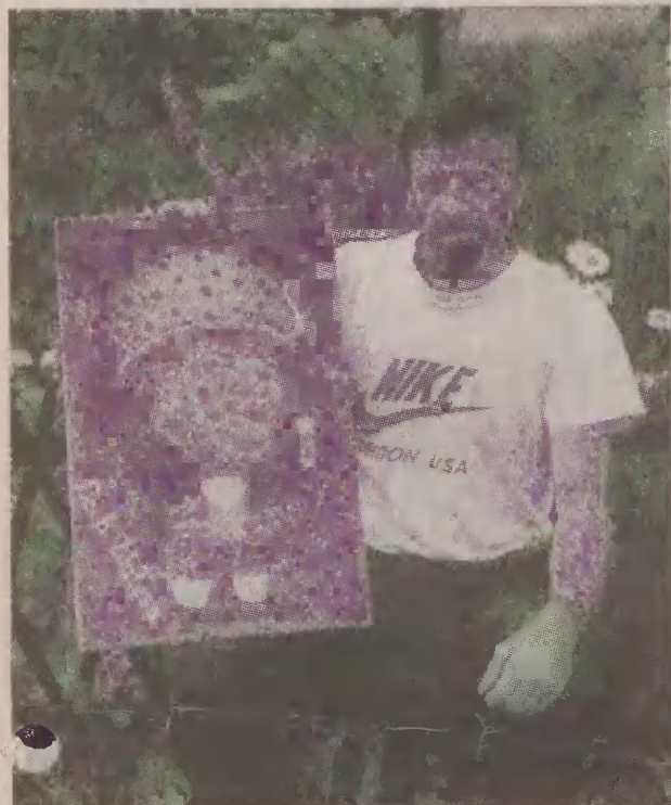
Lecha Wałęsę pan Zbigniew namalował na początku lat dziewięćdziesiątych.