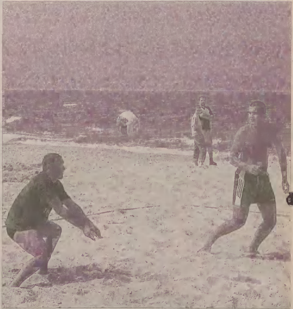
Turnieje plażowej piłki siatkowej są na plaży w Sztutowie bardzo popularne.