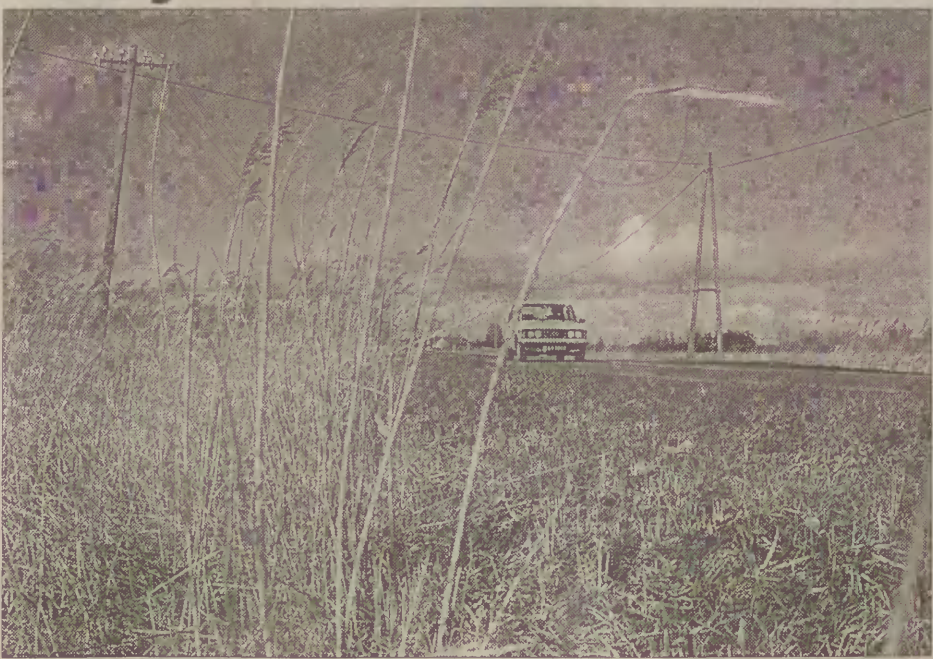
Wycinaniem trzciny powinni zajmować się właściciele gruntów, jednak rowy często pozostają zarośnięte.

Do obkaszania rowów zobowiązani są właściciele gruntów, na których one się znajdują. Właścicielami gruntów są zazwyczaj rolnicy. W gestii gminy Nowy Dwór Gdański leży obkaszanie rowów komunalnych. Są to rowy znajdujące się przy ulicy Morskiej i Kopnickiej. Przy tej ostatniej wykonane zostały dwa sztuczne rowy w celu odprowadzenia zbierającej się w nadmiarze, w jedynym istniejącym tam rowie „burzówki”. Rolnicy obkaszają