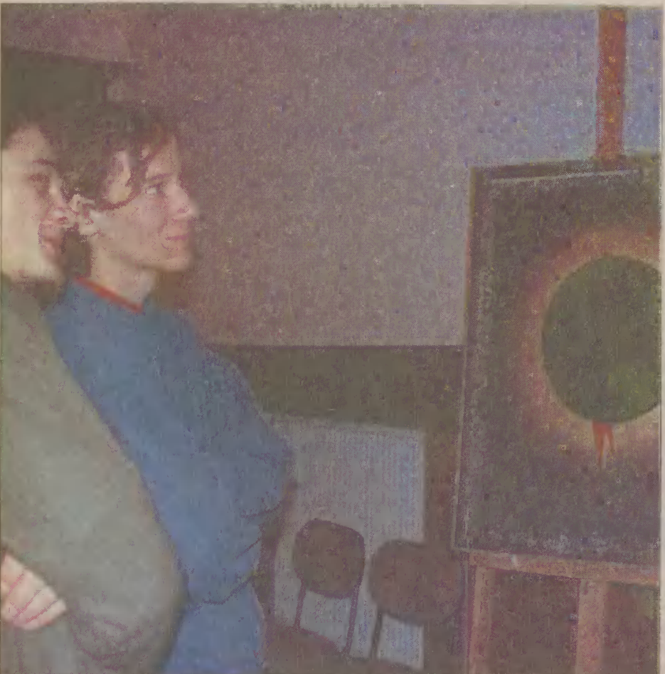
Dzieła Hasiora obejrzała nowodworska młodzież i dorośli.