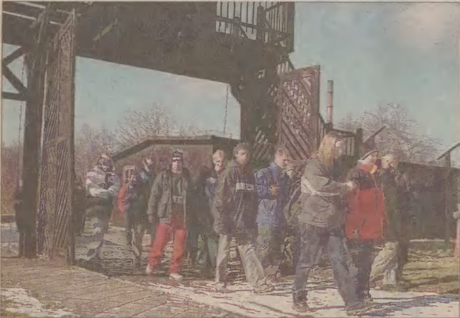
Wycieczki Szwedów do Muzeum Stutthof mają charakter edukacyjny.