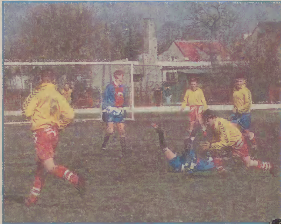
Juniorzy Żuławy Nowy Dwór Gdański pokonali Powiśle Stary Targ 2:1.

Zgodnie z przewidywaniami, na boisku, gdzie większość pola gry zajmuje błoto, nie było mowy o pięknej grze. Bardzo ciężko było zorganizować jakąkolwiek akcję, aby piłka nie zatrzymała się w błocie. Szczególnie przez pierwsze dwa-dziesiąt minut piłkarze nie