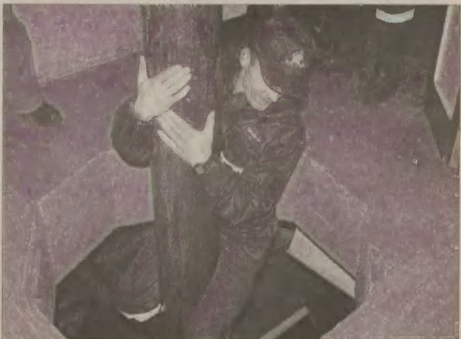
Każda akcja strażaków wiąże się z zagrożeniem ich życia.