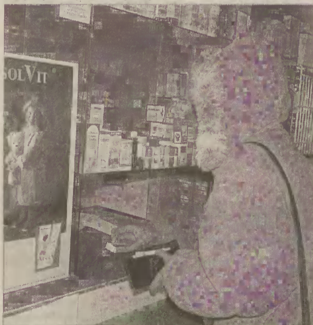
Od ponad dwóch tygodni z półek nowodworskich aptek znikają preparaty hamujące rozwój grypy.