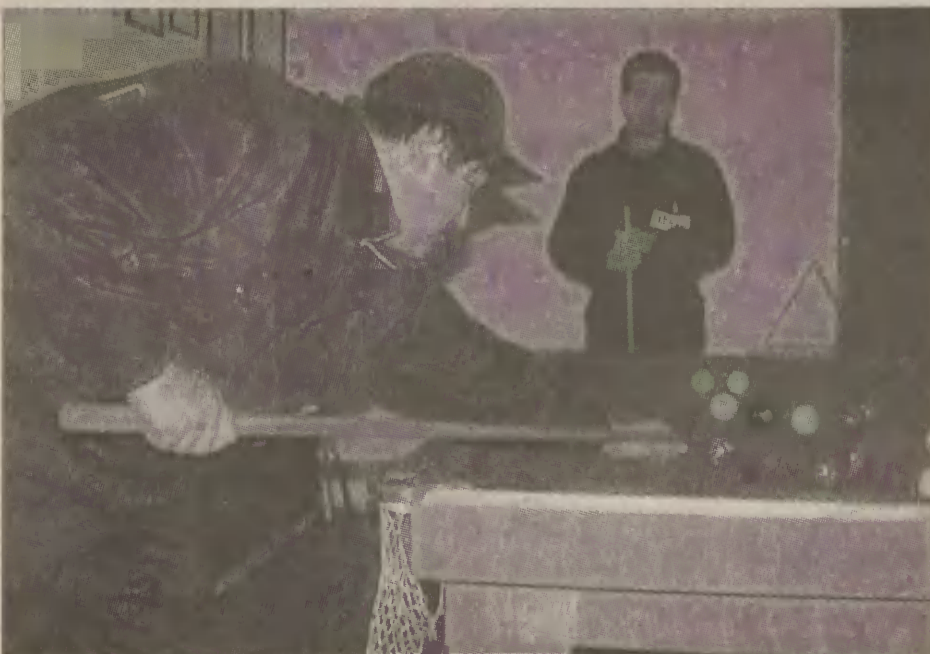
W czasie służby, kiedy nie trzeba interweniować strażacy korzystają z przeznaczonej specjalnie dla nich świetlicy.

nywania tego zawodu jest wykształcenie minimum średnie, najlepiej z maturą. Mile widziane są także prawo jazdy i różne umiejętności między innymi pływanie.