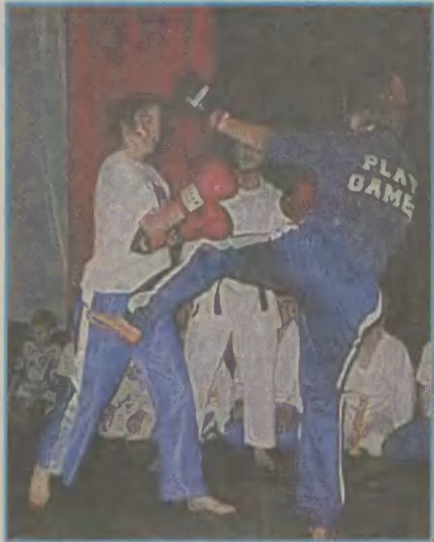
Członkowie sekcji Gepard spędzą sześć dni na obozie szkoleniowym w Dębiniu