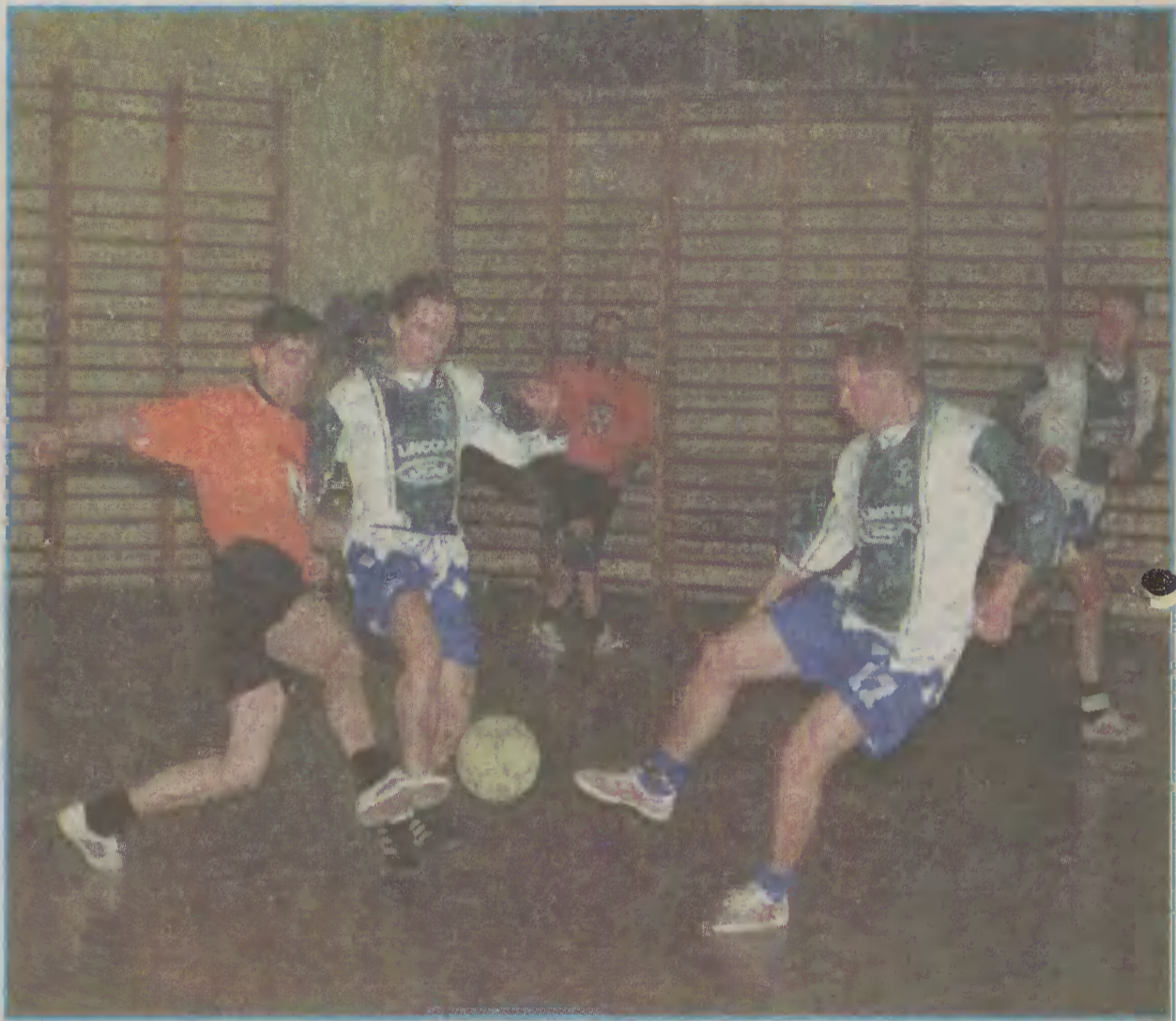
Piąta kolejka rozgrywek I ligi elbląskiej halowej piłki nożnej przyniosła awans nowodworskiej drużynie.