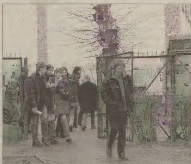
Już od poniedziałku rozpoczynają się ferie zimowe.