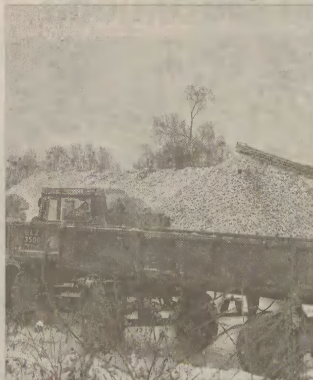
Nie wiadomo jeszcze, jak będzie wyglądała następna kampania buraczana.