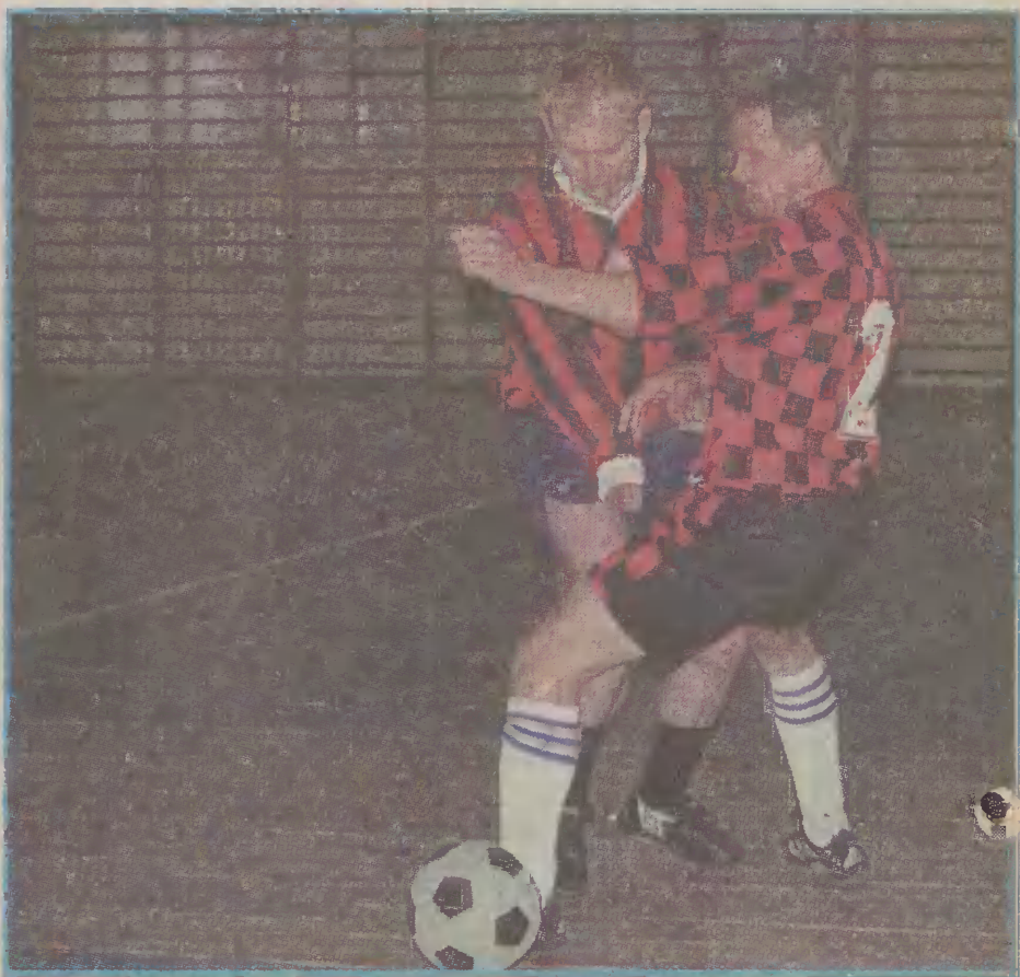
Kolejne mecze w Żuławskiej Halowej Lidze Piłki Nożnej dostarczyły dużo emocji kibicom.

W drugiej lidze największą niespodzianką w rozgrywkach była na pewno słaba postawa Gwardii, która w dwóch meczach zdoby-