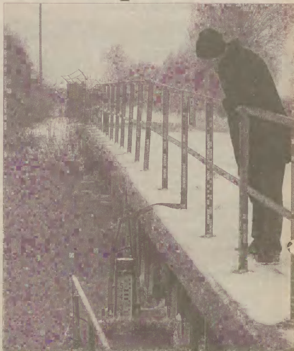
Terenom powiatu nowodworskiego bardzo często grozi powódź.

Powiat nowodworski jest przygotowany na ewentualną powódź. W Krynicy Morskiej, Gniazdowie, Pioninie, Grochowie i Łaszcze znajdują się magazyny, w których Wojewódzki Zarząd Melioracji i Urządzeń Wodnych przechowuje łopaty i worki do piasku, niezbędne w razie wystąpienia wód z koryt. W starostwie utworzony został Komitet Przeciwpowodziowy. Do jego zadań należy obserwowanie wysokości stanu wody. Organizowaniem bezpieczeństwa i sprawowaniem kontroli nad nim zajmuje się starostwo. Także w tym celu opracowano specjalny plan zapobiegawczy oraz zmodernizowano większą część wałów. Komitet Przeciwpowodziowy reaguje dopiero, gdy zostanie ogłoszony alarm kryzysowy, do tego