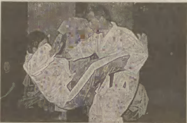
W nowodworskim Żuławskim Ośrodku Kultury działa sekcja samoobrony „Gepar”.