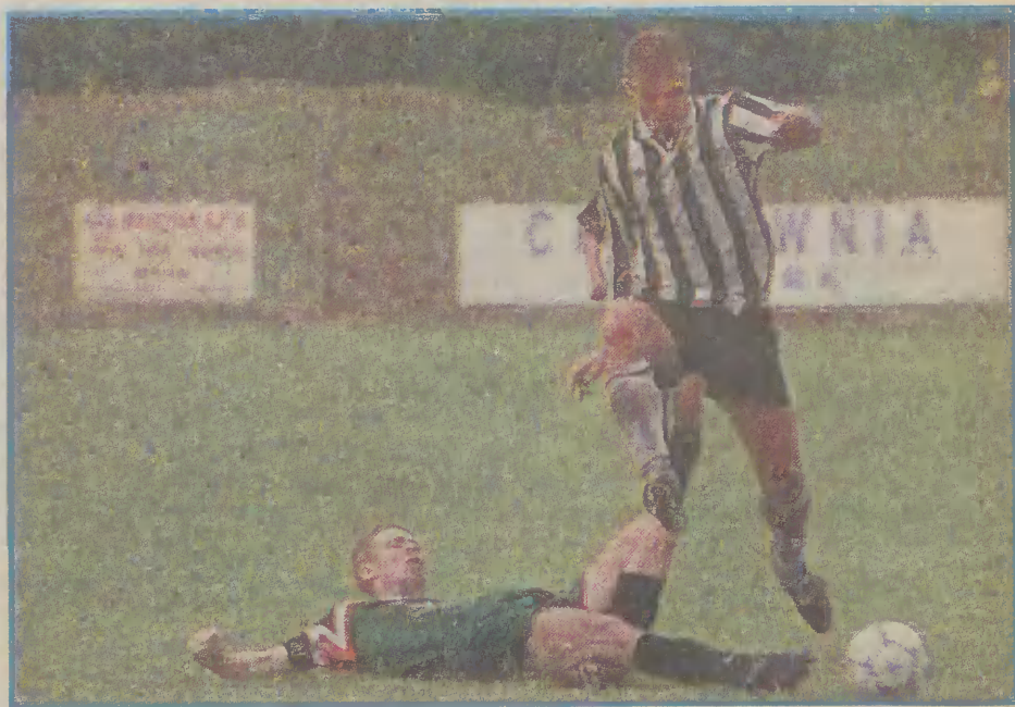
Malborczycy nie sprościli rezerwom warszawskiej Legii. Przegrali na własnym boisku 1:2.

Malborczycy mogli w 14 minucie podwyższyć rezultat spotkania. Jednak Salami nie wykorzystał sytuacji sam na sam z Kowalewskim. Jego strzał z 10 metrów trafił interweniującego gołkiperę prosto w brzuch. Chwilę później Solnica doprowadził do remisu. W zamieszaniu przed polem kar-