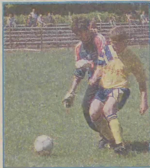
Po wysokiej wygranej z Gryfem Słupsk malborczycy przegrali 1:2 spotkanie z Wisłą Tczew.

Juniorzy starsi Młodzieżowego Ośrodka Piłkarskiego Pomezania przegrali 1:2 (1:2) pojedynek z Wisłą Tczew. Tym samym nie awansowali na szóste miejsce w tabeli ligi makroregionalnej.