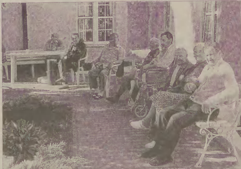
Pod opieką Powiatowego Centrum Pomocy Rodzinie w Malborku jest, m. in. Dom Pomocy Społecznej w Malborku.

By ubiegać się o refundację, trzeba mieć rachunki oraz orzeczenie o inwalidztwie.