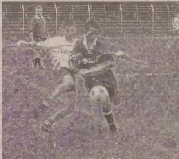
Młodzicy MOP Pomezania BeGeF '87 grają z kadrą województwa pomorskiego.

17.00 Twarz roku W Garnizonowym Klubie Oficerskim w Malborku, przy ulicy Sikorskiego 33, odbędą się wybory „Twarz roku”. Podczas imprezy odbędzie się także pokaz mody. 28 maja 11.00 Piłka nożna Na stadionie przy ulicy Portowej w Malborku zmierzą się zespoły MOP Pomezania i Wierzyca Starogard z rocznika 1989. Wstęp wolny. 12.00 Piłka nożna Na stadionie przy ul. Toruńskiej w Malborku zespoły MOP Pomezania i KOP Kwidzyn z rocznikami '85 i '86 rozegrają mecze piłki nożnej. Wstęp wolny. 12.30 Piłka nożna Na stadionie przy ulicy Portowej w Malborku odbędzie się mecz piłki nożnej pomiędzy MOP Pomezania '88 a Lechią Gdańsk. 14.00 Piłka nożna Na stadionie przy ulicy Portowej w Malborku MOP Pomezania BeGeF - 87 zmierzy się z Bałtykiem Gdynia. Wstęp wolny. (Niki)