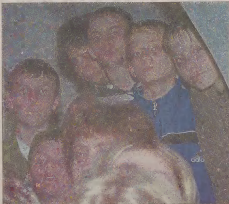
Na wernisaż malarstwa i rzeźby przyszło dużo młodzieży.

kości rzeźby mojego męża. To bardzo ważne dla nas miejsce - dodaje.