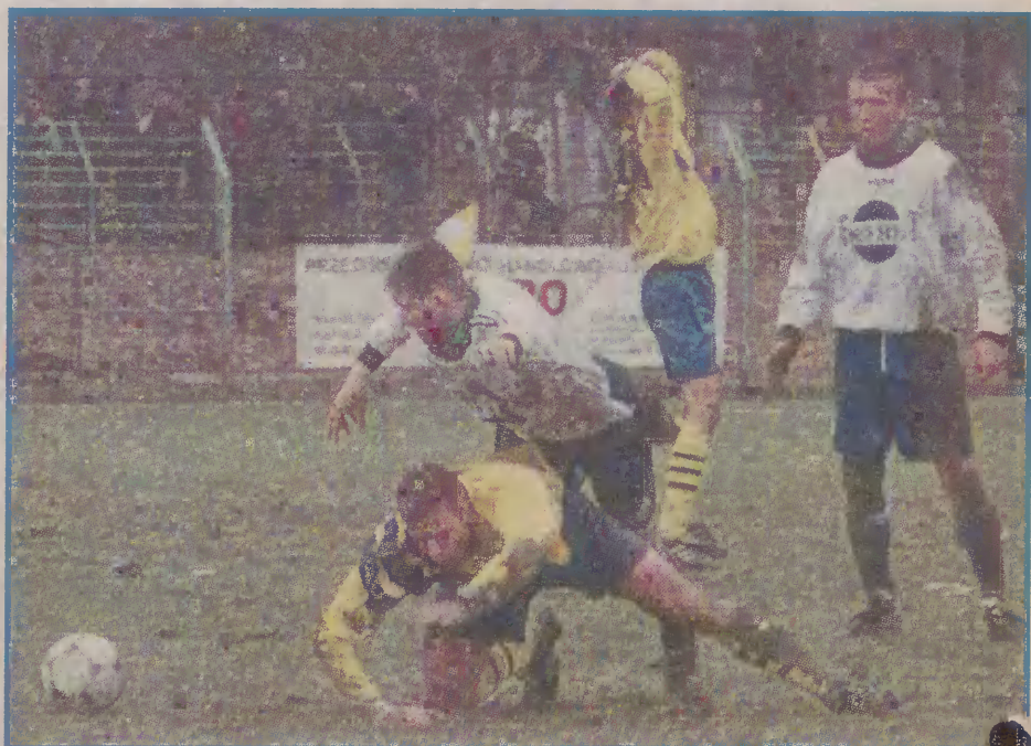
Po serii porażek malborczycy i tym razem ulegli Goplani Inowrocław.