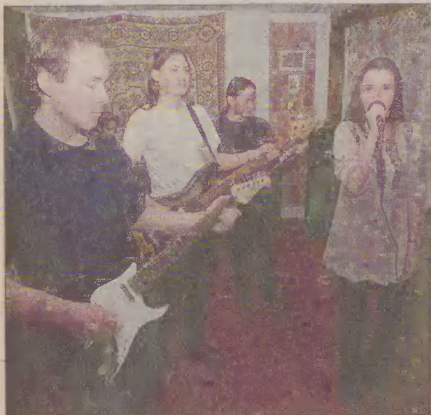
Zespół Hoth w czasie próby w Młodzieżowym Domu Kultury.