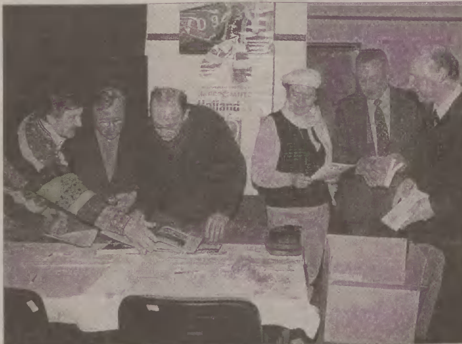
W Miejskim Domu Kultury przy pl. Słowiańskim w Malborku we wtorki prowadzony jest kurs nauki międzynarodowego języka esperanto.

Pieniądze na pomnik można wpłacać na konto Big Bank Gdański II o/Malbork 11601289-31860-132 do końca maja z dopiskiem „Pomnik Zamenhofa”