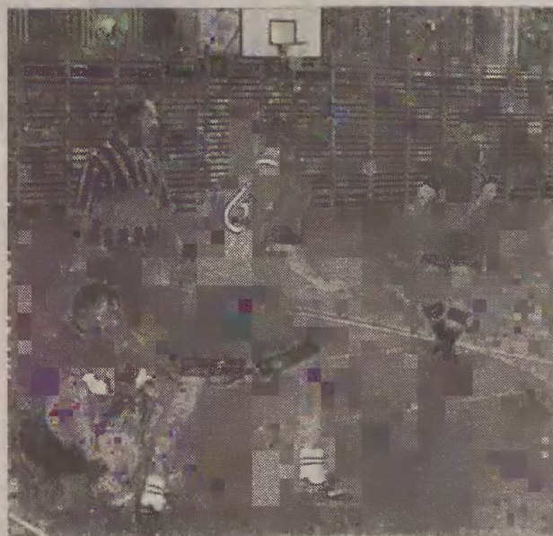
Piłka halowa cieszy się dużą popularnością.