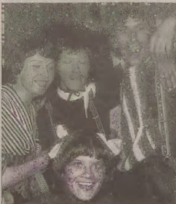
Sportowcy dwa razy w roku wyjeżdżali na obozy. Tam nie tylko biegali, brali również udział w potańcówkach.