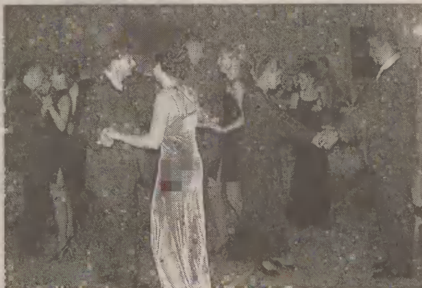
W ten weekend, podobnie jak w ubiegły, w Malborku odbędzie się wiele zabaw karnawałowych.