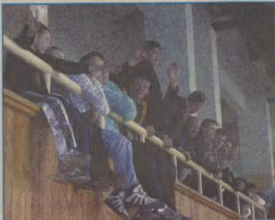
Kibice gorąco dopingowali zawodników grających na boisku.