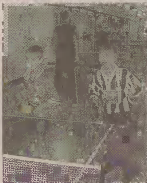
Uczniowie malborskich szkół angażują się w rozgrywki tenisowe.

20.00 Dyskoteka DJ Buźka zaprasza starszą młodzież na imprezę, która odbędzie się w Garnizonowym Klubie Oficerskim