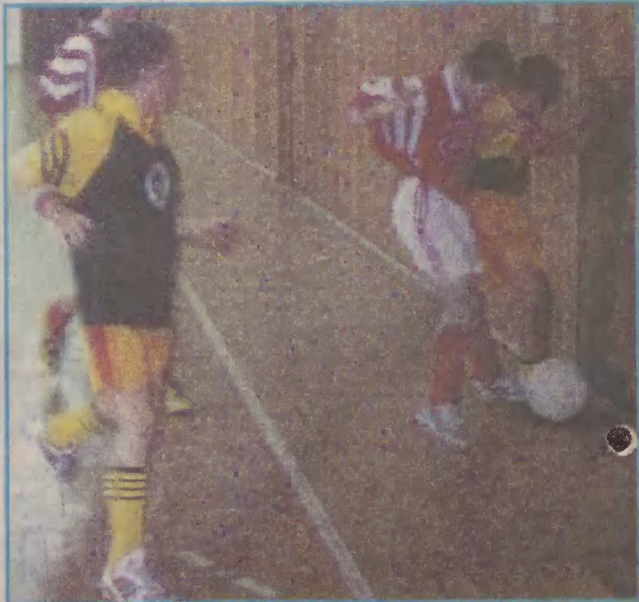
Zawodnicy podczas turnieju walczyli o każdą piłkę.

Na drugiej pozycji znaleźli się piłkarze Pomezania II Malbork, którzy zwyciężyli w 2 spotkaniach. Zdobyli 10 bramek, a stracili 4. Trzecie miejsce zajęła Delta