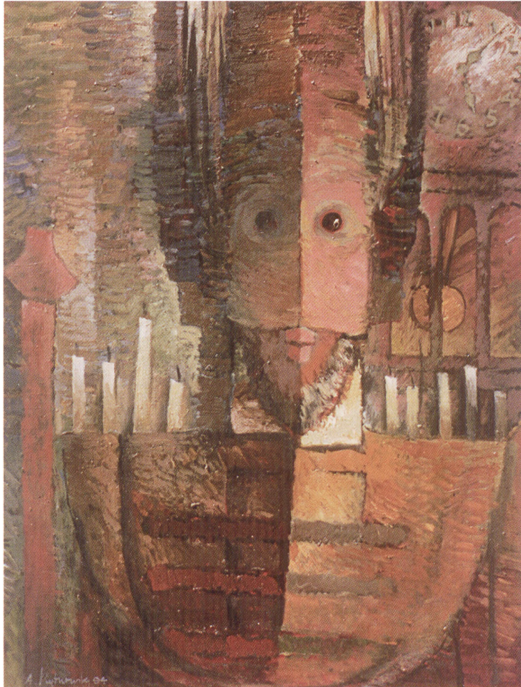
Autoportret zamaskowany 80 x 67