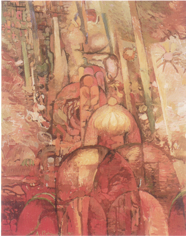
W tynie 85 x 70