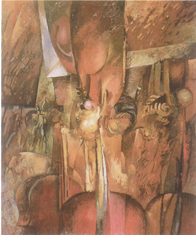
Instrumenty 115 x 95