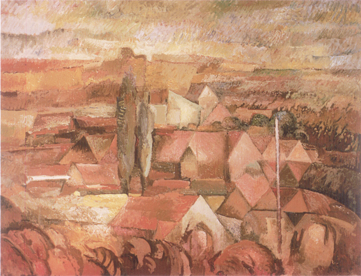
Topole 102 x 80