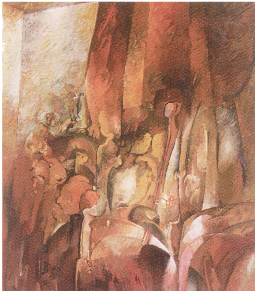
Sytuacja sugeruj ca 115 x 95