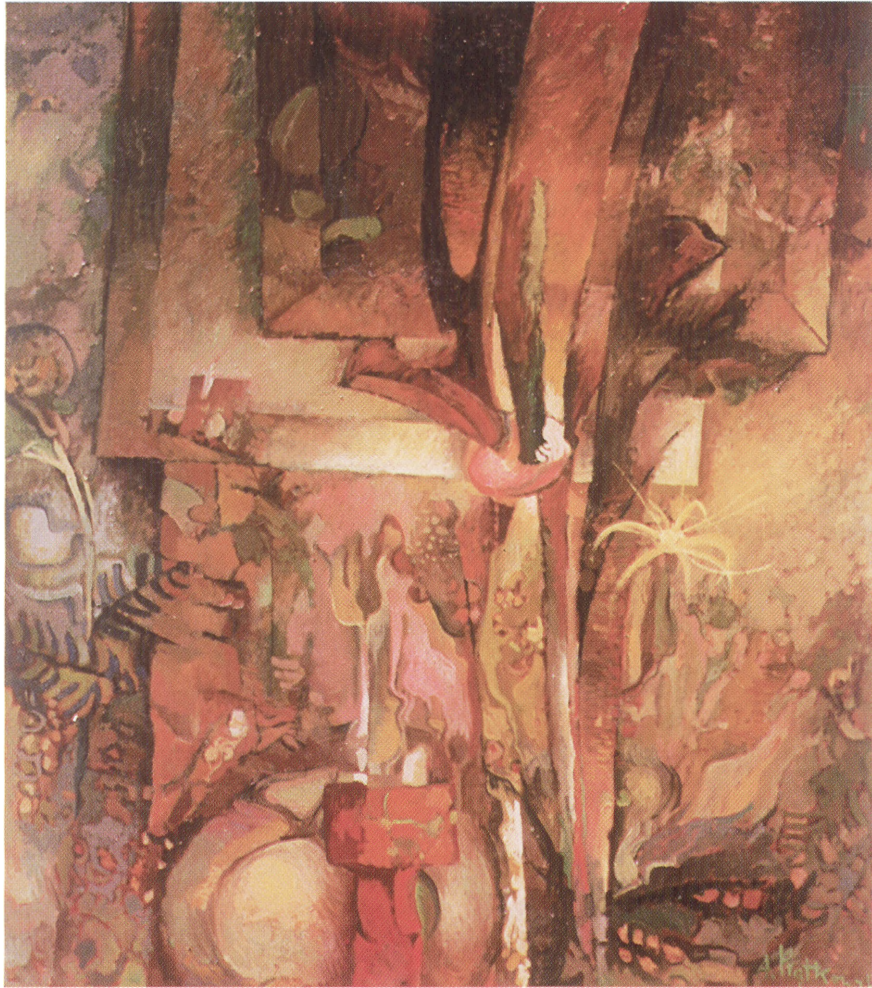
Przy cianie 90 x 80