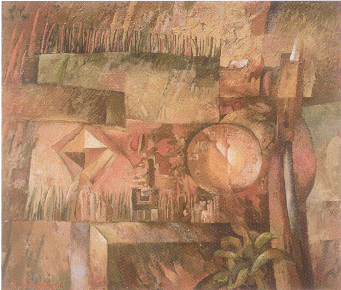
Papierowy zegar 113 x 97