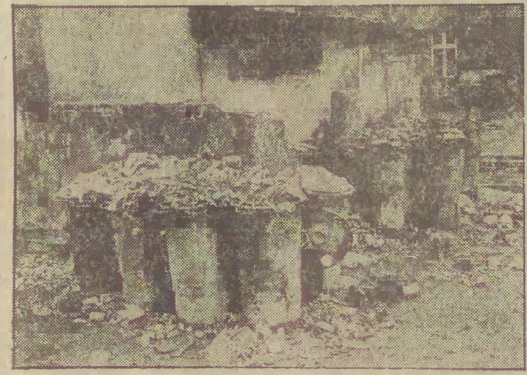
Tu nie da się już nic upchnąć — ul. Łąkowa 13.