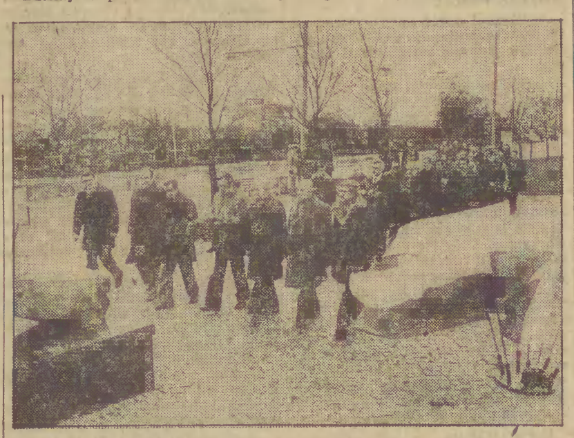
Składanie kwiatów pod pomnikiem w Gdyni.

nowa tragedia roku 1970 jest jasną i czytelna dla wszystkich. Dzisiaj w przedmiedniu dwunastego rocznicy tamtych wydarzeń oddano hold pamięci poległych. O godz. 9 deleg. społeczeństwa złożyły