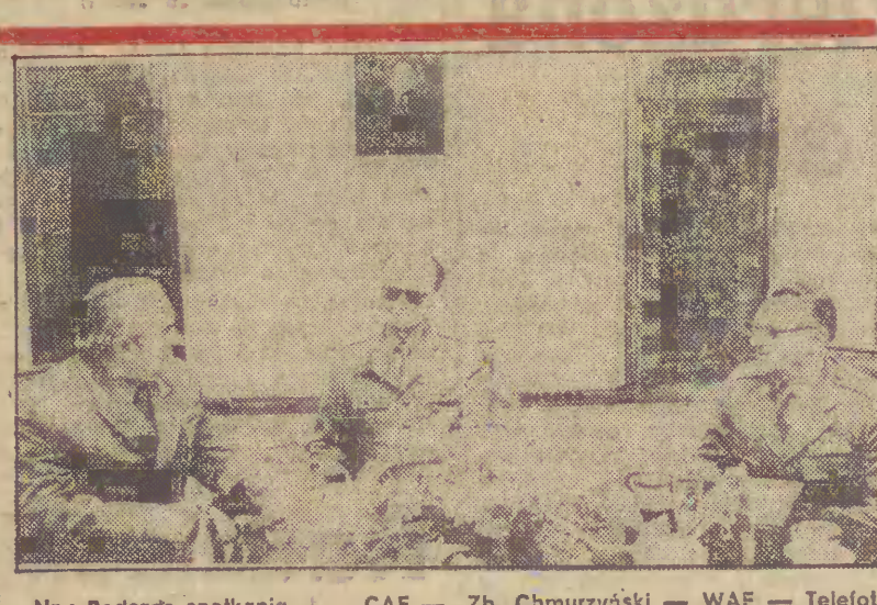
Nz.: Podczas spotkania.

I sekretarz KC PZPR, prezes Rady Ministrów PRL, przewodniczący Wojskowej Rady Oceny Narodowej, gen. armii Wojciech Jaruzelski przyjął wczoraj naczelnego dowódcę Zjednoczonych Sił Zbrojnych państw — stron Układu Warszawskiego marszałka Związku Radzieckiego Wiktora Kulikowa, który przebywał w wizycie roboczej w Polsce.