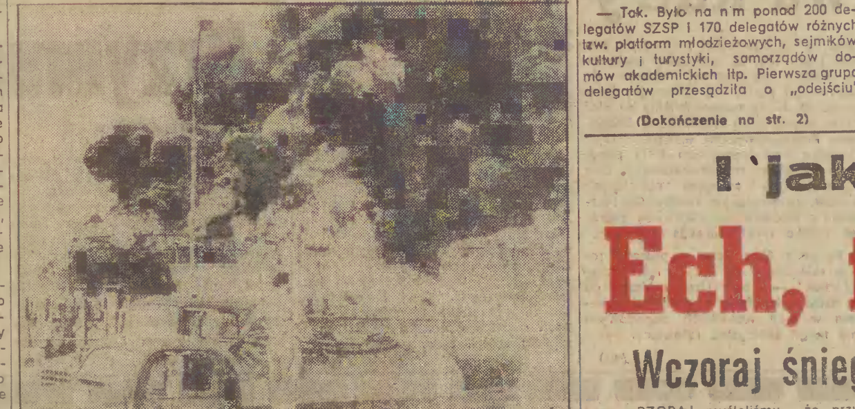
14 bm. nastąpił w Bogocie (Kolumbia) wybuch gigantycznego zbiornika z benzyną o pojemności 14 mln l. Nz.: strażacy walczą z płonącą benzyną.