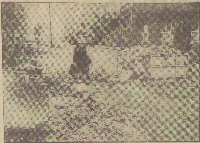
Tak wygląda teren posesji przy ul. Jaskółczej.