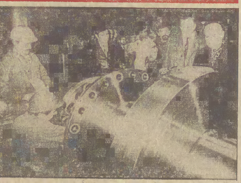
Przebywający w Poznaniu wicepremier ZSRR — Nikołaj Bajbakow odwiedził niektóre fabryki Zakładów Przemysłu Metalowego „H. Cegielski”. Niz: podczas zwiedzania Fabryki Silników Okrętowych.

Z faktów, zachodzących w polityce światowej, należy wyciągnąć wnioski dotyczące przede wszystkim stanu świadomości twórców tej polityki. Blokada programu MX jest potwierdzeniem nadziei tych ludzi, którzy liczyli na zdrowy rozsądek, realizm i pragmatyzm Amerykanów. Prezydent Reagan nazwał krągnących postów lunatykami, (Dokończenie na str. 2)