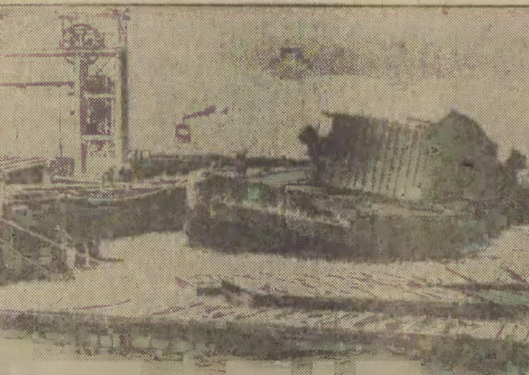
Sztorm u wybrzeży Kalifornii (USA) spowodował duże straty w zatoce San Francisco. Wichura zmiotła do wody kilka samochodów osobowych, przyczepy kontenerowe i cysternę pełną kanadyjskiej whisky.