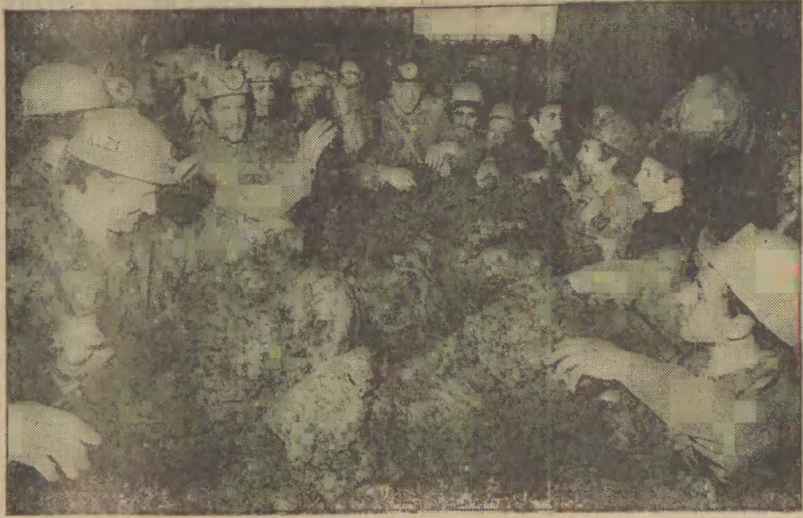
Wczoraj zakończony został pierwszy etap budowy Kopalni L.Z.W., a rozpoczęła się normalna przemysłowa eksploatacja złoża. W pierwszym etapie będzie się wydobyci ok. 800 ton na dobę, a po dalszej rozbudowie, planuje się 12 tysięcy ton na dobę. N.z.: pierwszy wózek z urobkiem na powierzchni. Wszyscy chcą mieć kawałek na pamiątkę.