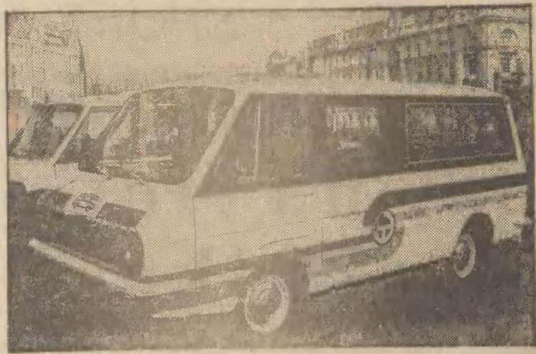
Jeg'awskie zakłady samochodowe w ZSRR wypuściły na rynek nowy model mikrobusu o napędzie elektrycznym z 23-kilowatowym silnikiem...