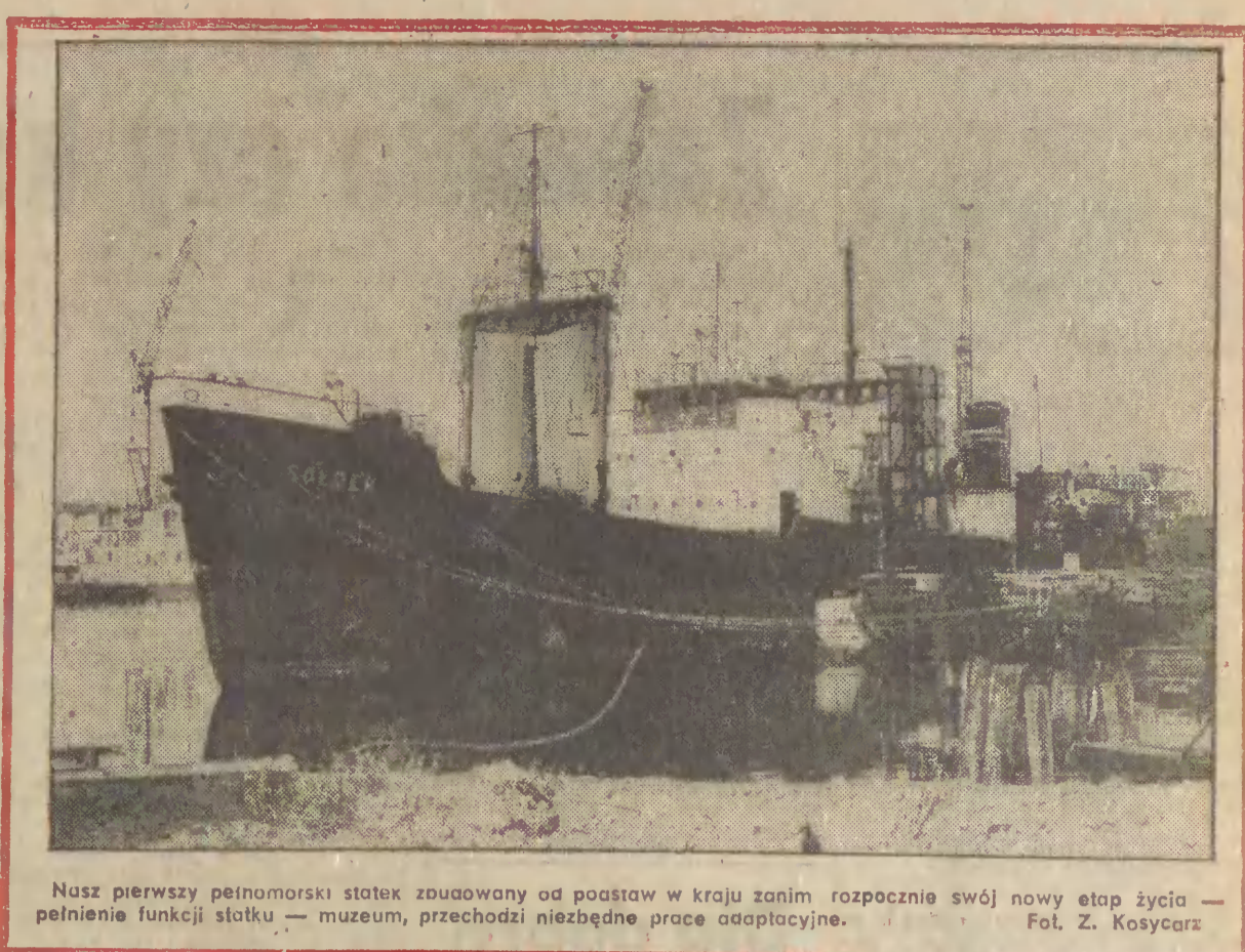
Nasz pierwszy pełnomorski statek zbudowany od podstaw w kraju zanim rozpocznie swój nowy etap życia — pełnienie funkcji statku — muzeum, przechodzi niezbędne prace adaptacyjne.