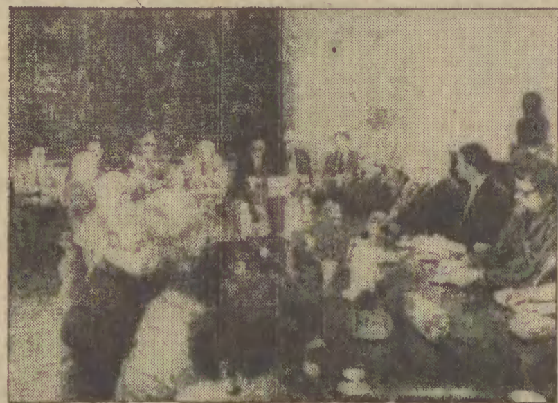
Nz.: podczas posiedzenia.