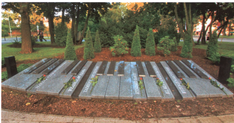
KLAWIATURA GWIAZD FPP