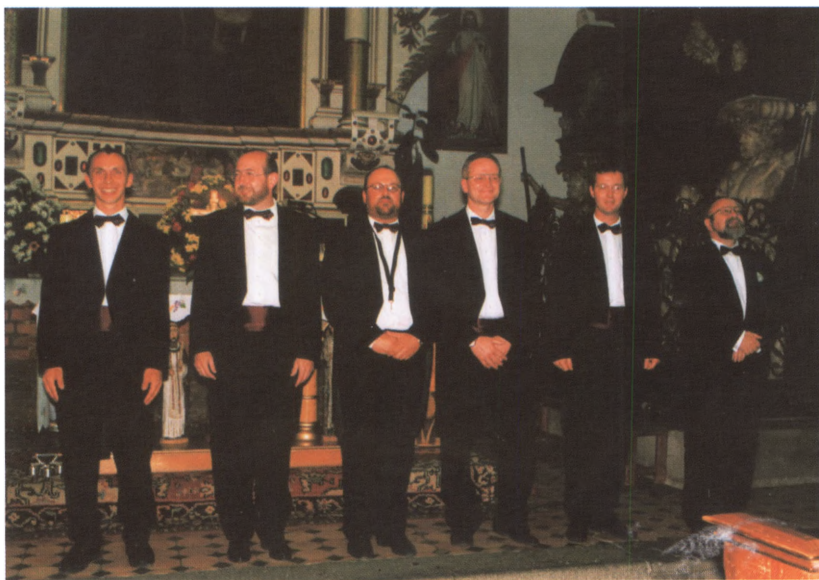
XIII FMOiK w 1995 r. Koncert II Gruppo Stravagante (Austria)