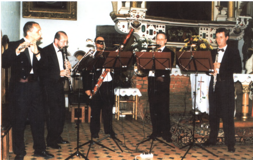
XIII Festiwal Muzyki Organowej i Kameralnej w ko cieł w. Jacka zespół kameralny „Stella Brasa” z Austrii - 2000 r.