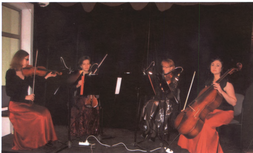
Koncert kameralny w wykonaniu Kwartetu Słupskiego 17 XII 2013 r.