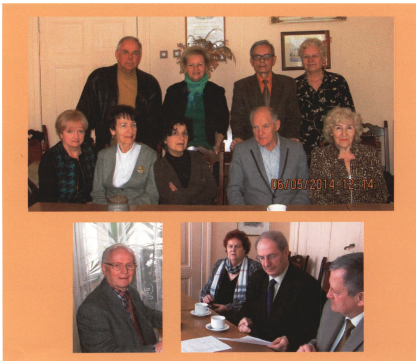
Członkowie Zarz du STSK w kadencji 2010-2015