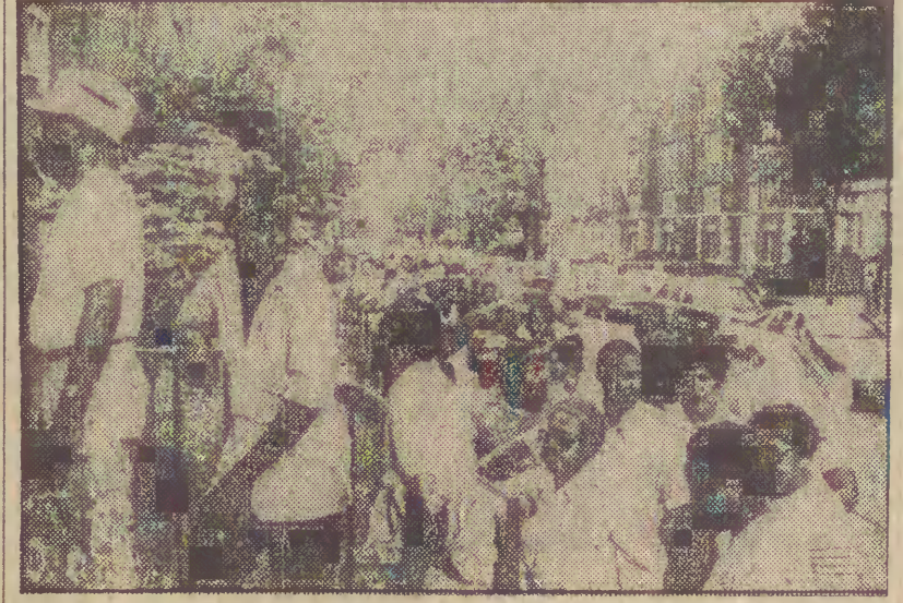
To także Ameryka: kolejka złożona z kolorowych mieszkańców robotniczej dzielnicy Waszyngtonu, czekających na darmową zupę dla bezrobotnych, wydawana przy kościele metodystów. W stolicy Stanów Zjednoczonych działa blisko 60 takich kuchni przy organizacjach charytatywnych. Według oficjalnych statystyk, liczba osób żyjących poniżej granicy ubóstwa zwiększyła się z 31,8 do 36 milionów do końca tego roku. Stanowiąc to będzie 16 procent całego społeczeństwa. Tymczasem wydatki na cele socjalne w przyszłorocznym budżecie uległy redukcji o blisko 50 mln dolarów.