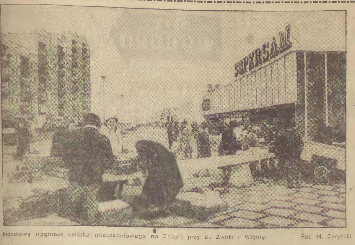
Hotełowy fragment osiedla mieszkaniowego na Zaspie przy ul. Zwirki i Wigury.