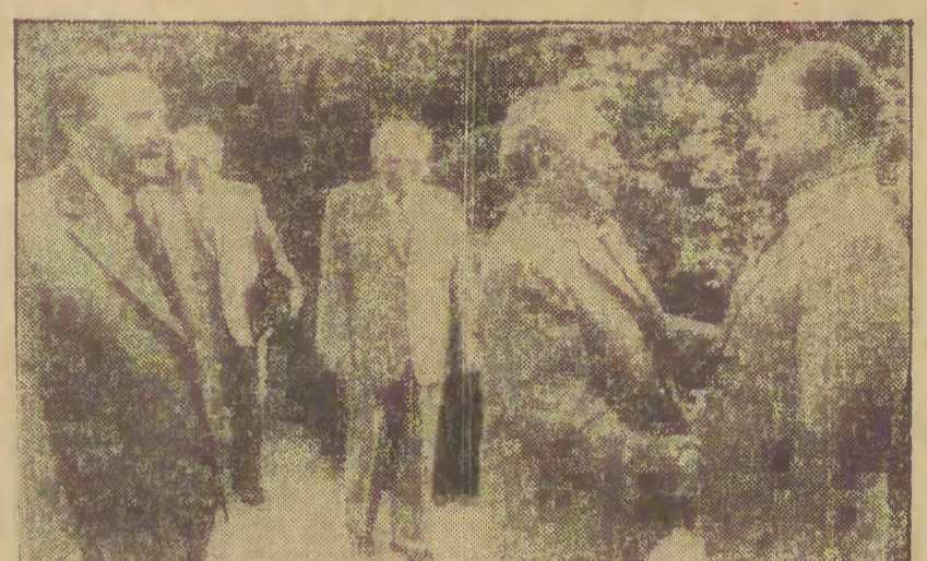
N/z: moment powitania. Obok stoi minister spraw zagranicznych ZSRR

P IERWSZY sekretarz KC PZPR, prezes Rady Ministrów PRL, Wojciech Jaruzelski spotkał się na Krymie z sekretarzem generalnym KC KPZR, przewodniczącym Prezydium Rady Najwyższej ZSRR, Leonidem Breżniewem.