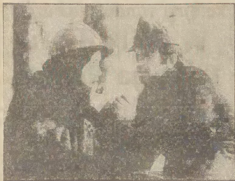
Scena z filmu „Gniazdo złoczyńców“.

Film Sergia Nicolaeu „Gniazdo złoczyńców“ posiada wszystkie walory dobrego filmu sensacyjnego, a dystans w stosunku do epoki (akcja rozgrywa się w r. 1918, tuż po zakończeniu wojny światowej, na terenie Transylwanii) przynosi element egzotyki. Jest to historia o cholernego oddziały samobójczy walcącego z grupą najemników, dowodzonych przez miejscowego dziedzica. Celem rozgrywki jest nie tylko sprawa na czyją stronę prze-