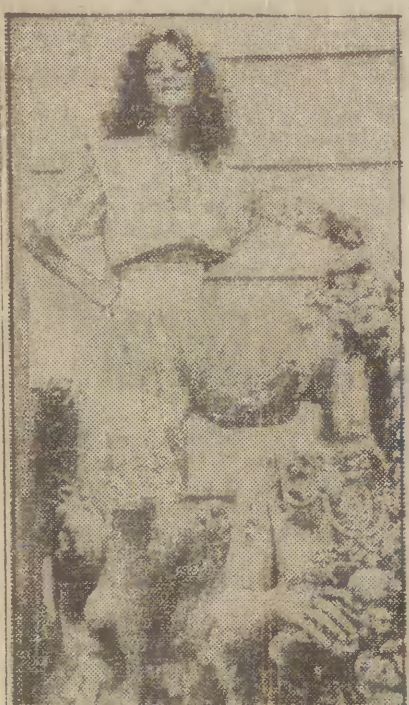
Korona łączona z dzianiną daje — jak widać to na wiedeńskiej modelce — całkiem interesujące efekty...