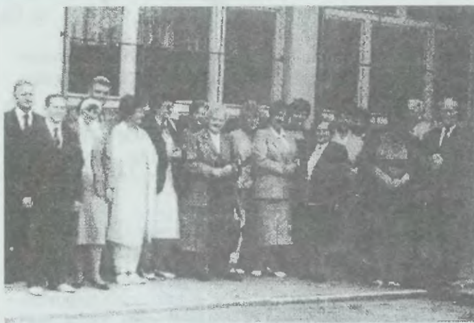
Zdjęcie części uczestników "Spotkania". Koleczkowo 25 czerwca 1995 r.