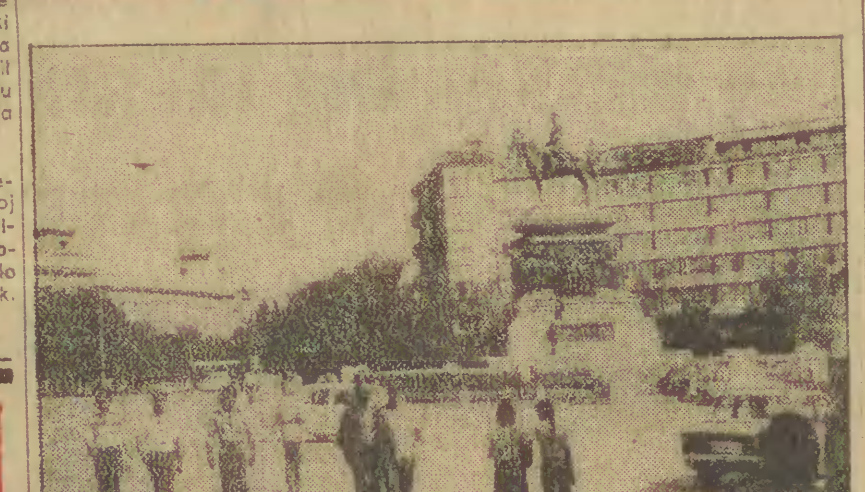
BULGARIA, Plac Zgromadzenia Narodowego w Sofii.

Po 2 miesiącach przerwy dziś stają wznowione w Genewie radziecko - amerykańskie rokowania w sprawie ograniczenia broni nuklearnych na kontynencie europejskim. Od wstępu przebywa na miejscu delegacja radziecka, której przewodniczący Julij Kwiński. Na czele delegacji USA stoi Paul Nitze. Rokowania są prowadzone przy drzwiach zamkniętych.