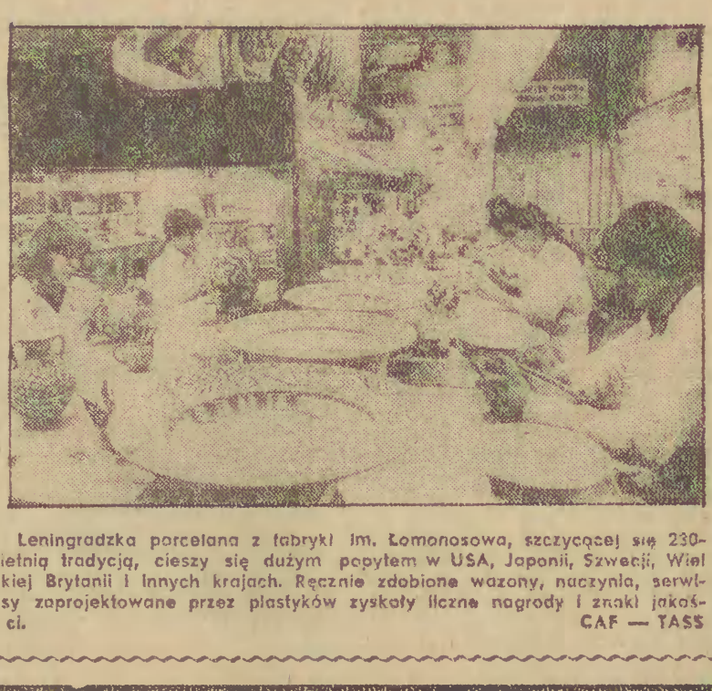
Leningradzka porcelana z fabryki im. Lomonosowa...