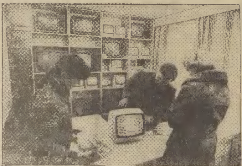
Punkt sprzedaży „Neptunów”.