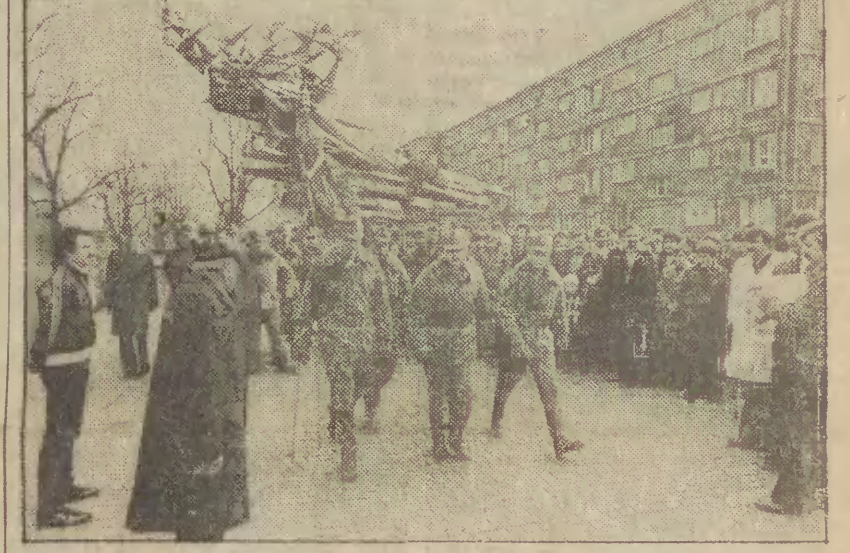
Drużyna jednostki WOP wyrusza na trasę.