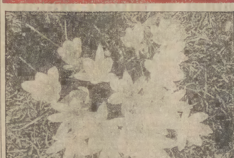
W wrocławskim Ogrodzie Botanicznym pojawiły się pierwsze zwiastuny nadchodzącej wiosny. Zakwitły już śnieżyczki, trisy, krokusy i lesczyna. N.z.: wiosenne kwiaty.