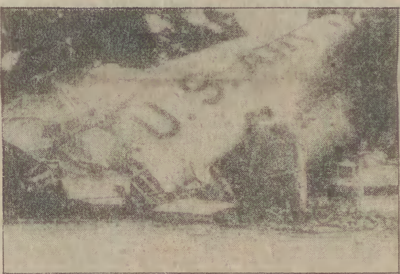
27 osób zginęło podczas katastrofy samolotu należącego do amerykańskiej Gwardii Narodowej w Wonder Lake Illinois.

W rezydencji premierów brytyjskich przy Downing Street 10 w Londynie rozpoczęły się rozmowy między Margaret Thatcher i Indirą Gandhī. Przedmiotem spotkania premierów W. Brytanii i Indii są problemy polityki międzynarodowej oraz zagadnienia stosunków dwustronnych, w zakresie których między Londynem i Delhi istnieją zasadnicze rozbieżności.