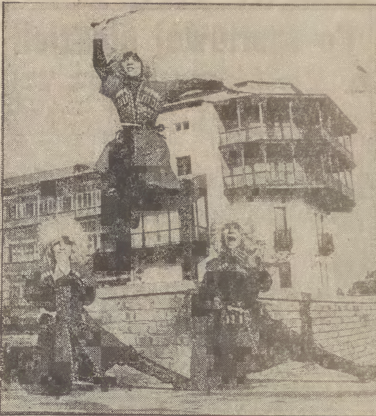
Zespół choreograficzny przy szkole eksperymentalnej nr 3 w Tbilisi powstał przed 20 laty, jest laureatem festiwalu w „Arleku”, uczestniczył też w festiwalu młodzieży w Hawanie, występował wielokrotnie za granicą, m. in. w Polsce. Na zdjęciu: chłopcy z gruzińskiego zespołu.