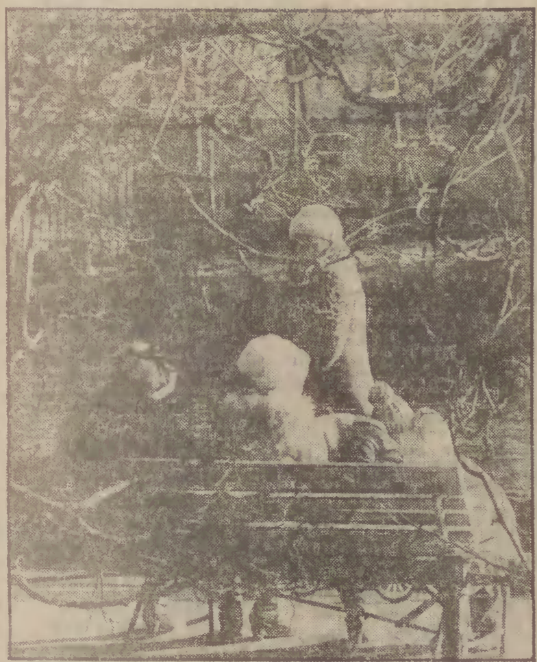
Park Oliwski jest miejscem spacerów i wypoczynku dla mieszkańców nie tylko Oliwy.