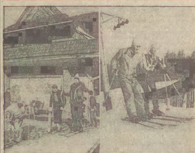
Marzec w górach przyciąga zawsze wielu amatorów dobrego wypoczynku na świeżym powietrzu. Organizatorzy wieców pracowniczych uruchamiają więc niekiedy domy czasowe w znanych miejscowościach — w Szklarskiej Porębie, Karpaczu, Bukownicy Tatrzkiej i w innych kurortach. Dom Wczasowy kapłani „Miechowo” w Kociczy (woj. bielski), dysponujący 60 miejscami dla pracowników zakładów przemysłowych w Bytomiu, wznowił działalność z dnem pierwszego lutego br. Oczekiwanego wyciągu narciarskiego umożliwiają wczasowiczom korzystanie z uroków zimy. Na miejscu można wypożyczyć sprzęt i ekwipunek narciarski.