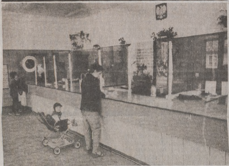
Niedawno w Koszalinie otwarto nowy Urząd Pocztowo-Telekomunikacyjny. Mieści się on w pawilonie, obok klubu osiedlowego „Bałtyk“, przy ulicy Spokojnej. Z tej nowej inwestycji najbardziej ucieszą się mieszkańcy osiedla mieszkaniowego „Morska“, bo dotychczas nie było tam poczty. (pat)