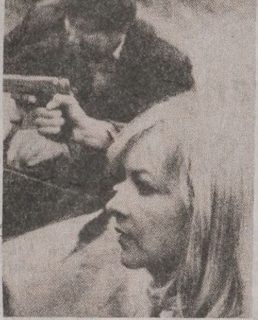
Akcja nowego serialu TVP „Republika Ostrowska” (pr. I, godz. 8.30 i 22.05) rozgrywa się podczas Powstania Wielkopolskiego w 1918 r. wśród uczniów Gimnazjum i Liceum Męskiego w Ostrowie Wielkopolskim (stad tytuł filmu). W filmie grają m. in. Jerzy Kamela, Czesław Wołłejko, Leon Niemczyk i Barbara Brylska (na zdjęciu).

Serwis Trójki: 7.00, 9.00, 12.00, 15.00, 18.00, 17.00, 18.00 6.00-9.05 Zapraszamy do Trójki 9.05 Gwiazda tygodnia 9.15 „Legenda