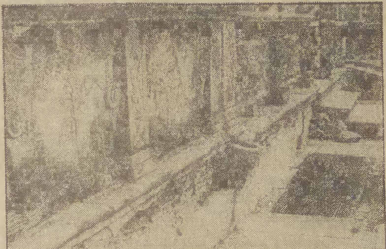
Największy czas ażeby ratować ten piękny fragment przedproża. (mz)