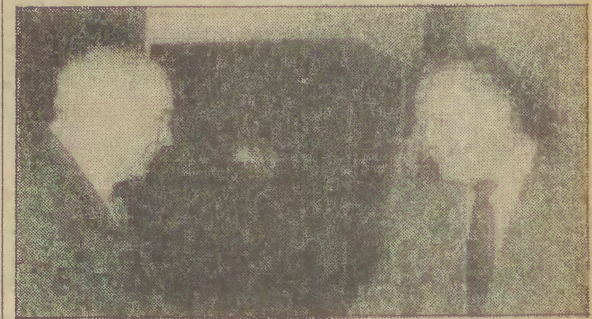
Na zdjęciu: podczas spotkania.