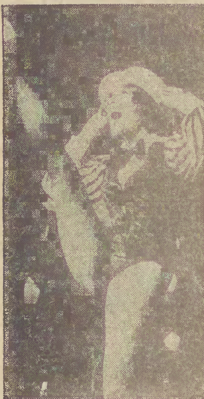
Program rozrywkowy z Shirley McLaine.