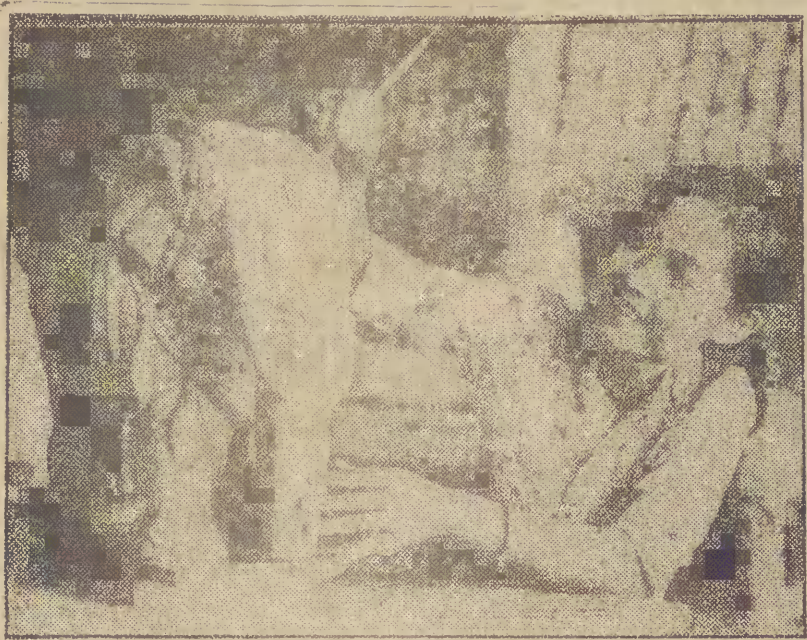
WIETNAM. Porcelana z Bien Hoa jest dobrze znana wśród kolekcjonerów w różnych krajach.