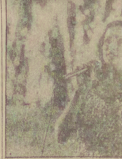
W moskiewskim studio filmowym „Mosfilm” powstaje obecnie kolorowy film muzyczny pt. „Dusza”.