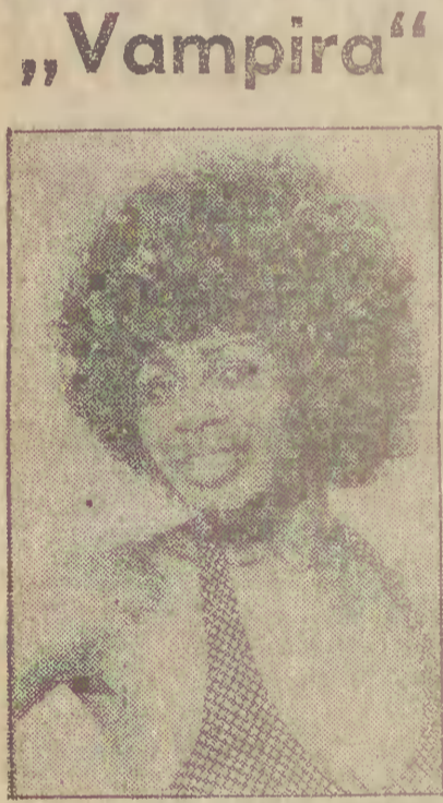
Egzotyczna modelka Minah Bird gra jedną z ról w nowym amerykańskim filmie pt. „Vampira“.