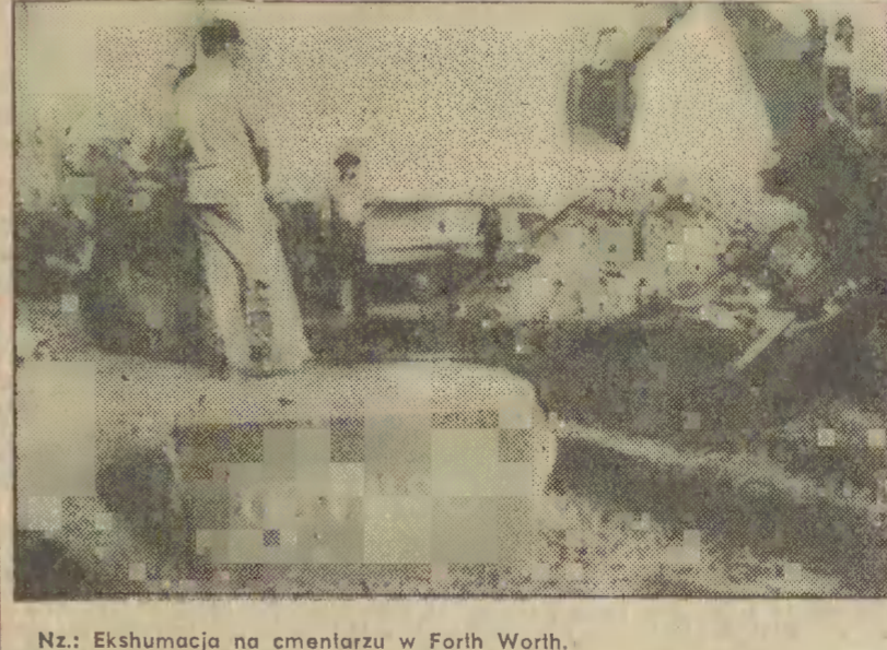
N.z.: Ekshumacja na cmentarzu w Forth Worth.

Dokonując identyfikacji zwłok rozwiano jeszcze jedną z wielu fantastycznych teorii na temat śmierci prezydenta Kennedy'ego i jego zabójcy.