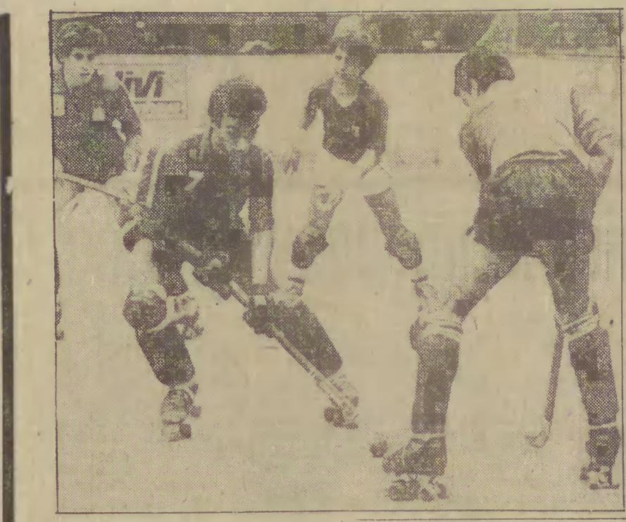
W wielu krajach dużą popularność cieszy się, nierzadko w Polsce, ho- kej na wrotkach. Niedawno w Essen zakończyły się 35 mistrzostwa Europy w tej dyscyplinie sportu. Zwycięzcy reprezentacja Hiszpanii, która w fi- nałowej wygrała 6:3 z Włochami.

9.00 - Dla młodych widzów: „Sobótka” 10.25 - „Zołnierskie współdziałania”