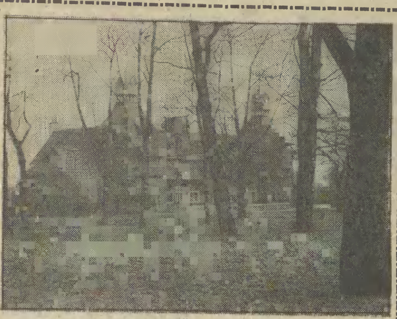
Łazienki Południowe w Sopocie.