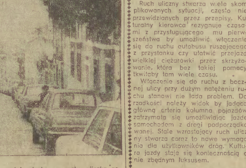
LIZONA, Obrazek typowy dla starej części miasta — wąska uliczka zaopchana do granic możliwości parkującymi samochodami.