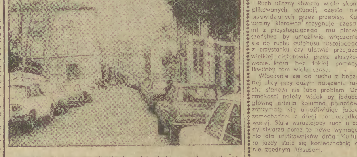
LIZONA, Obrazek typowy dla starej części miasta — wąska uliczka zaopchana do granic możliwości parkującymi samochodami.

Według statystyk policji, mnożące się uprowadzenia samochodów ciężarowych połączone są z licznymi wypadkami i terrorem słownym wobec kierowców.