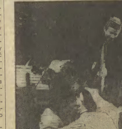
Scena zbiorowa ze sztuki S. Mroźka „Pieszko” w Teatrze im. W. Horzycy w Toruniu.