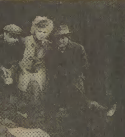
Scena zbiorowa ze sztuki S. Mroźka „Pieszko” w Teatrze im. W. Horzycy w Toruniu.