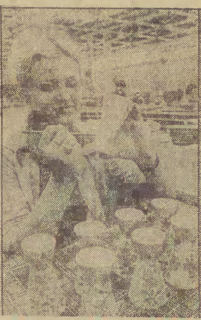
Wśród 10 tysięcy ton naczyn stołowych — talerzy, kubków, waz, filiżanek i innych wyrobów pojedynczych i w kompletach, jakie w br. planują wyprodukować Zakłady Porcelit, „Tułowice” w Tułowicach (woj. opolskie), będzie szereg nowości.

— Obywatele polscy wjeżdżający w celach turystycznych do państw socjalistycznych oraz Wielkiej Brytanii mogą korzystać z bezpłatnego leczenia na podstawie odpowiednich umów dwustronnych. W przypadku wjazdu do innych państw i posiadania przez turystę dobrowolnej polisy ubezpieczeniowej „Warty” urzędy konsularne mogą wypłacić zaliczki na poczet tego ubezpieczenia, jednak tylko do wysokości kwoty gwarancyjnie określonej w polisie ubezpieczeniowej. Wiele noszących turystów nie wie jednak o możliwości ubezpieczenia się w „Wartę”. Konsulaty nie dysponują natomiast środkami na udzielenie pomocy finansowej osobom, które nie posiadają polisy ubezpieczeniowej. Dlatego właśnie sugerowaliśmy, aby każdy obywatel polski przed wyjazdem za granicę zawarł w TUR „Wartę” umowę o ubezpieczenie kosztów leczenia i następstw nieszczęśliwych wypadków, tym bardziej, że koszt tego