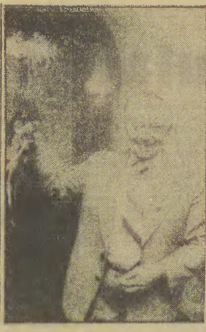
3 bm. w Ministerstwie Kultury i Sztuki w Warszawie minister J. Tejchma...