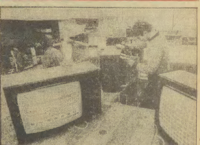
W nowym zakładzie produkcyjnym nr 2 — „Nowolipie” Gdańskich Zakładów Elektronicznych „Unimor”...