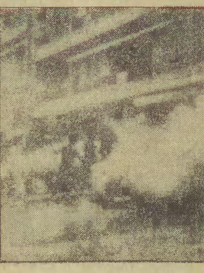
Walki w Bejrucie. Na zdjęciu: ploną samochody ostrzelane z moździerzy...