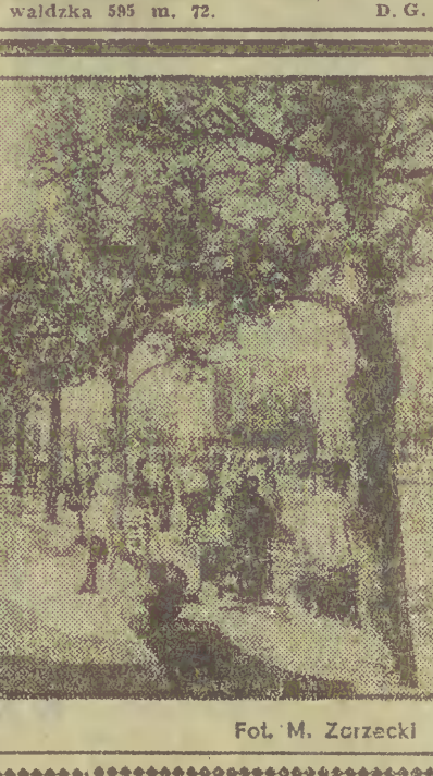
Centrum Wrzeszcza