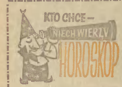
NA PIĄTEK — 22 maja