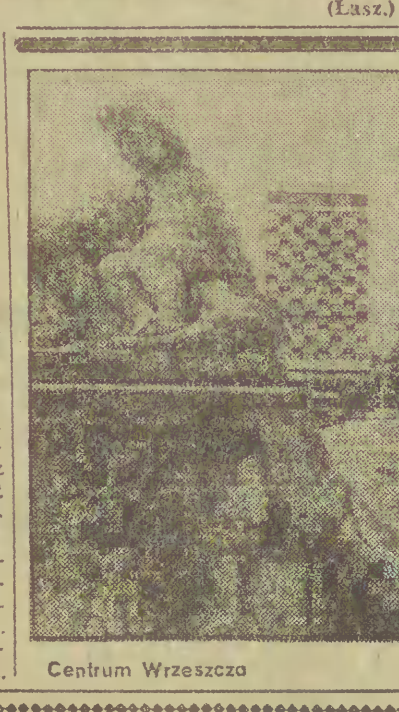
Centrum Wrzeszcza