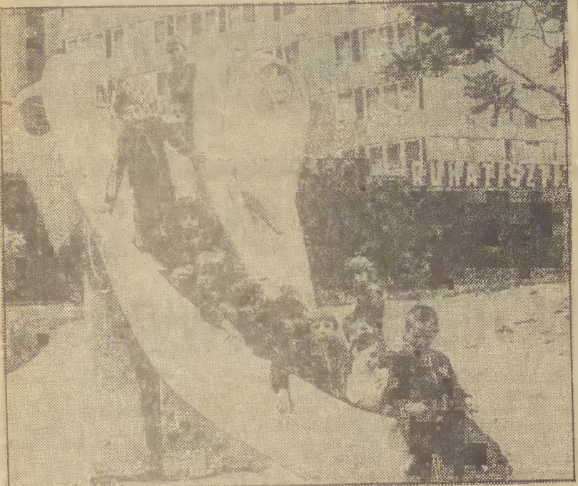
Węgry. Budapeszteński plastycy zaprojektowali różne urządzenia do zabaw na świeżym powietrzu. Ozdobity one stoliczne osiedla mieszkaniowe. Na zdjęciu: zjeżdżalnia w kształcie słonia.