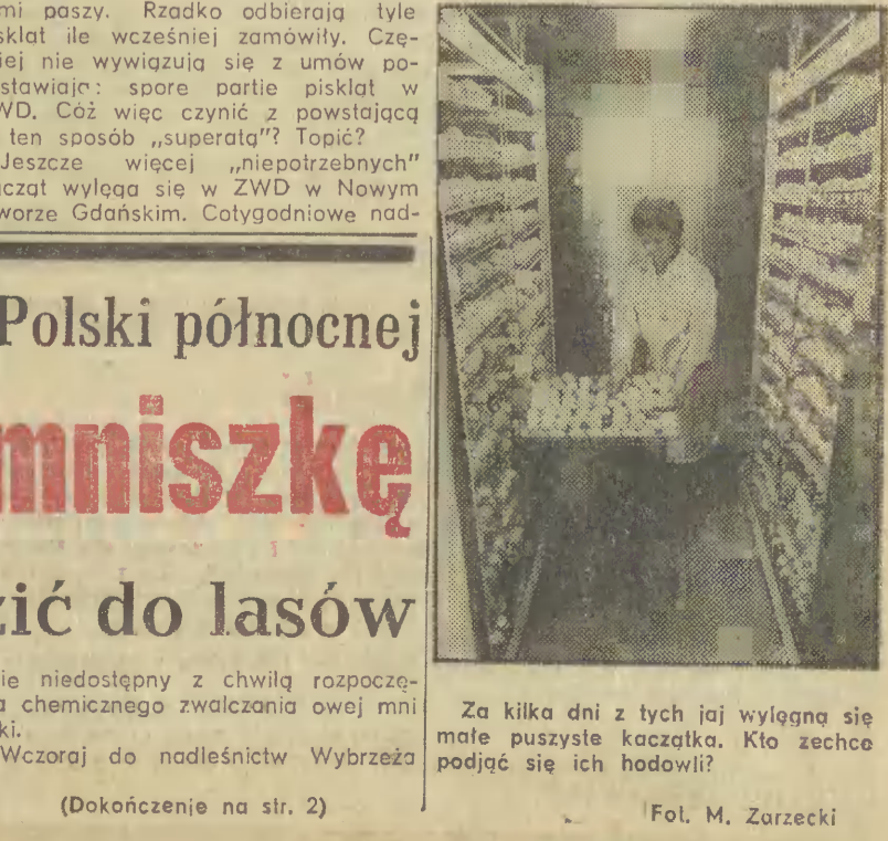
Za kilka dni z tych jaj wyłgna się małe puszyste kaczki. Kto zechce podjąć się ich hodowli? (Dokończenie na str. 2)

— Co się więc dzieje z pozostałymi tysiącami piskląt? — pytamy. (Dokończenie na str. 2)