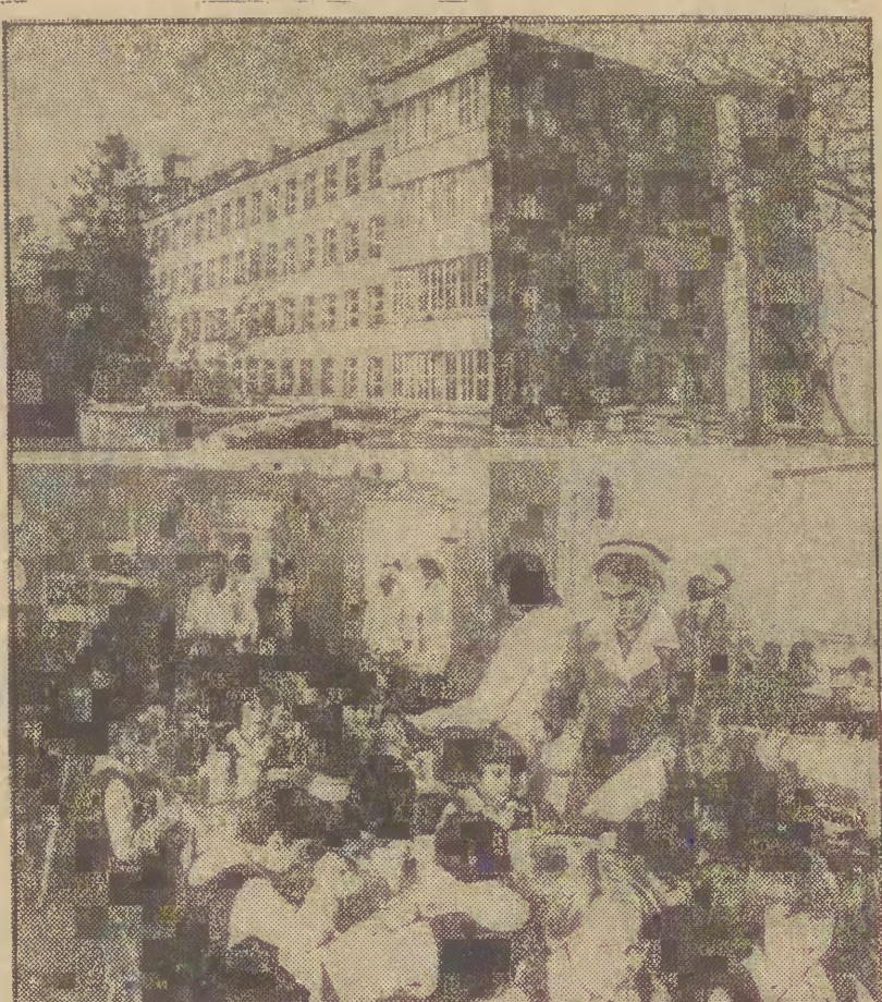
Nie wiadomo, kto pierwszy użył tego określenia, wiadomo, że przyjęło się powszechnie. „Pałac zdrowia” — tak mówią o sanatorium im. Wincenego Pastrowskiego w Rabce jego pensjonariusze. Jednorazowo w „Pałacu” przebywa 760 dzieci, natomiast od 1965 roku, kiedy to sanatorium przekształciło się w Śląski Ośrodek Rehabilitacji Dzieci, leczą się tu każdego roku ponad 35 tys. małych pacjentów.