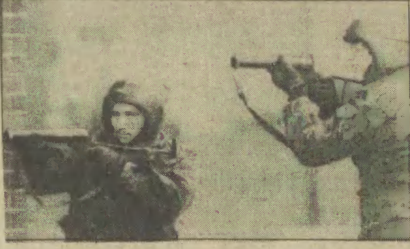
Uzbrojone patrole na ulicach Belfastu.