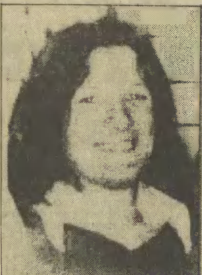
Robert Sands, członek „skrzydła tymczasowego” IRA.