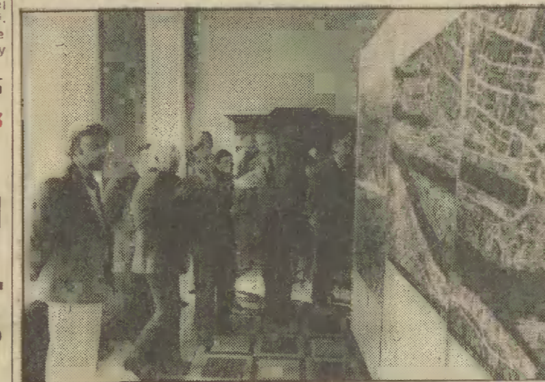
Otwarcie wystawy „Brema wczoraj i dziś”.

Wczoraj już od rana przed ratuszem na Długim Targu uwagę zwracała koncertująca na swojej nowoczesnej katarannie, członek zespołu teatru ulicznego z Bremy. O godzinie 11 licznicy goście przybyli do Ratusza Głównomiejskiego na wernisaż wystawy fotograficznej pt. „Brema wczoraj i dziś”.