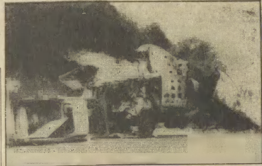
Na ulicach Londonderry doszło do zamieszek w związku z trwającym już 54 dni strajkiem głodowym przebywającego w więzieniu przywódcy IRA Boba Sandsa.

Ronald Biggs, organizator słynnego napadu na kolejkę autobusową w Glasgow — Londyn został uwolniony wczoraj przez sąd najwyższy w Bridgetown (Barbados). Sąd odrzucił apel władz brytyjskich o ekstradycję. Biggs zamierza powrócić do Brazylii.