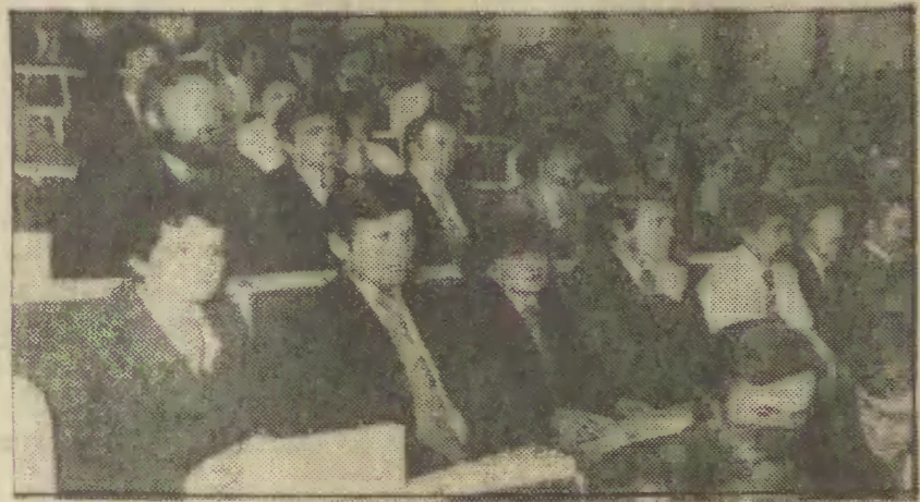
Delegacja młodzieży z województwa skierniewickiego.

Z obradami zjazdu związane są wielkie oczekiwania i nadzieje. Przed delegatami stoi odpowiedzialne zadanie trafnie określenia nowego programu działania zgodnie z socjalistycznym kierunkiem dokonującej się w życiu kraju odnowy.