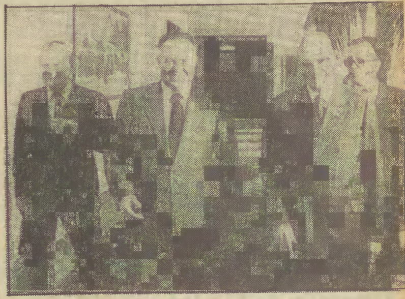
N/z: I sekretarz KC PZPR Stanisław Kania przyjął delegację KC KPZP jej przewodniczącym Michailem Susłowem.

Na zaproszenie Komitetu Centralnego Polskiej Zjednoczonej Partii Robotniczej do Warszawy przybyła wczoraj z przyjacielską wizytą delegacja KC Komunistycznej Partii