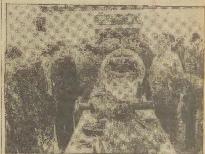
W sali bhp Stoczni Gdańskiej im. Lenina zorganizowana została giełda — wystawa części zamiennych potrzebnych rolnictwu. N/z.: giełda części zamiennych w Stoczni Gdańskiej.