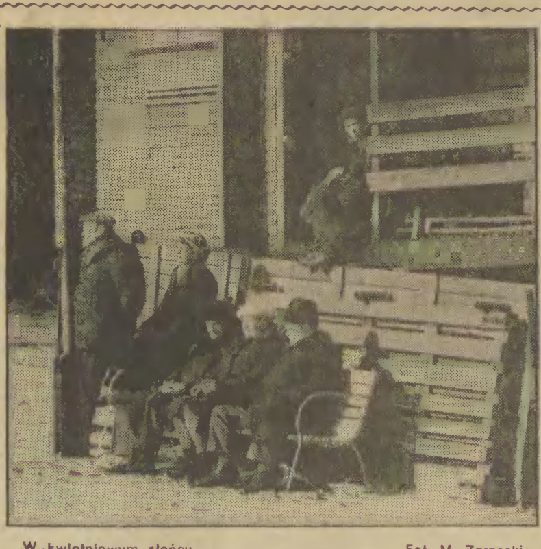
W kwietniowym słońcu.