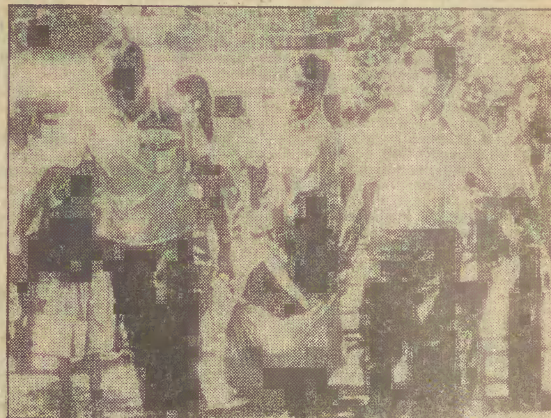
Na przedmieściach Salwadora znaleziono ciała 24 osób zamorawionych przez salwadorską juntę. N/z: rodzina niesie ciało jednego z zamordowanych.