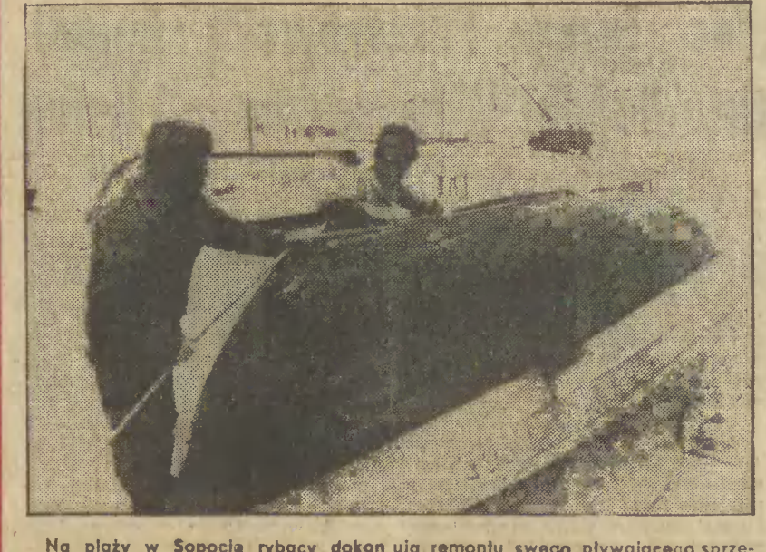
Na plaży w Sopocie rybacy dokonują remontu swego pływającego sprzętu. N/z: przy naprawie.