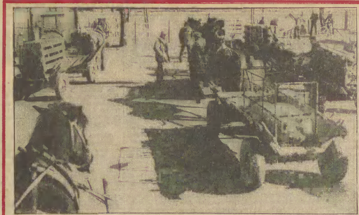
Poanieszenie cen na żywiec spowodowało wyraźne ożywienie w punktach skupu. Np. w punkcie w Radzynie kupowano dotychczas 2-3 sztuki dziennie, wczoraj 77, a dziś ponad 100. Utworzyły się nawet kolejki dostawców.